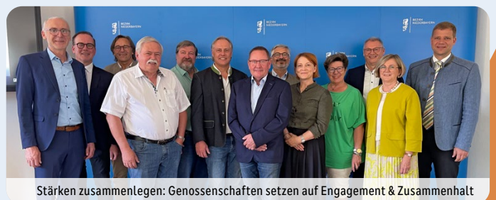
Stärken zusammenlegen: Genossenschaften setzen auf Engagement & Zusammenhalt