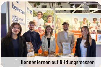
Kennenlernen auf Bildungsmessen