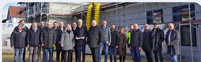
Richtfest für unseren zukunftsweisenden Neubau in Bad Birnbach