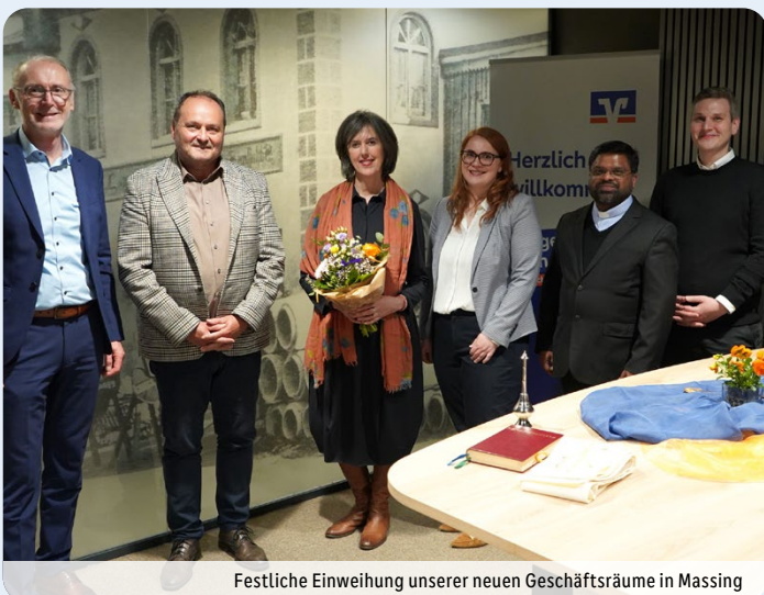
Festliche Einweihung unserer neuen Geschäftsräume in Massing