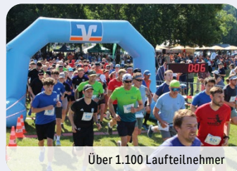
Über 1.100 Laufteilnehmer