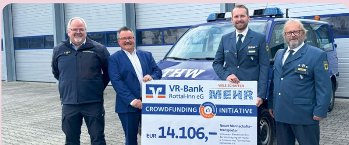
Crowdfunding – gemeinnützige Projekte finanzieren: viele-schaffen-mehr.de/vrbk