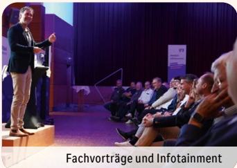
Fachvorträge und Infotainment