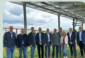
Netzanschluss Agri-PV Park Dorfen

Nachhaltiges Wirtschaften, das sich auszahlt.