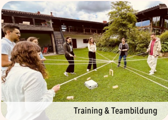
Training & Teambildung