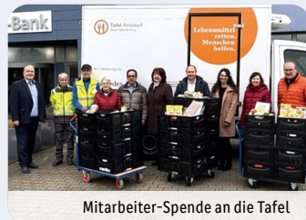
Mitarbeiter-Spende an die Tafel