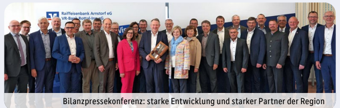
Bilanzpressekonferenz: starke Entwicklung und starker Partner der Region

Wir lieben unser Zuhause und fördern vielfältig unser Gemeinwesen.