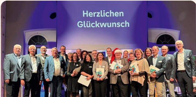
Ehrung langjähriger Mitarbeiter auf der Weihnachtsfeier