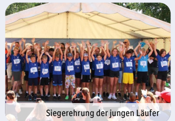
Siegerehrung der jungen Läufer