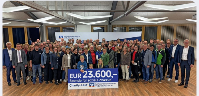
Charity-Lauf: Spendenübergabe an 118 Vereine und Institutionen