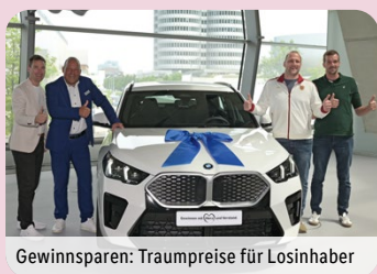
Gewinnsparen: Traumpreise für Losinhaber