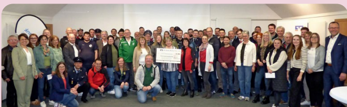
Gewinnsparen: jährliche Spenden-Ausschüttung an regionale Vereine