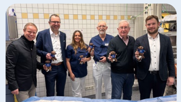
Trösterbären für die Rottal-Inn Kliniken

Wir sind seit 129 Jahren hier zu Hause und kennen Land und Leute.