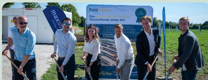
Spatenstich für größtes Agri-PV Projekt Süddeutschlands in Oberndorf mit 16,7 MWp