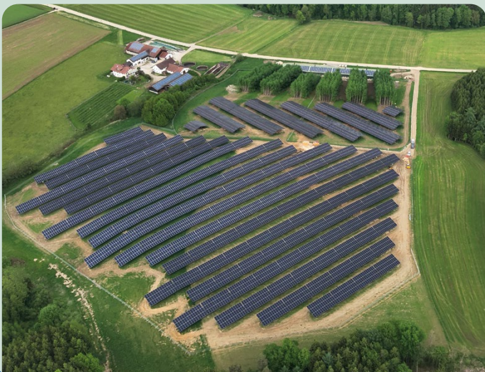
Inbetriebnahme des VR-Bank eigenen Agri-PV Parks in Einbach/Pfarrkirchen mit 5,4 MWp