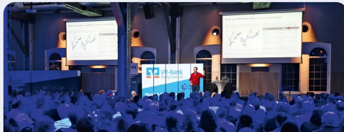
Information und Unterhaltung für unsere Mitglieder und Kunden