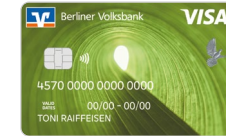
Naturliebe (nur Classic- und BasicCards) – Designcode 48