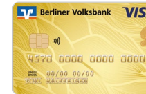
Gold Naturliebe Designcode 49