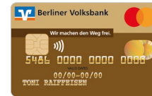
Standard Gold Designcode 1