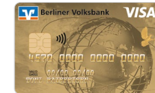
Gold Weltkugel Designcode 27