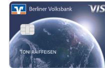
Heimatplanet Designcode 39