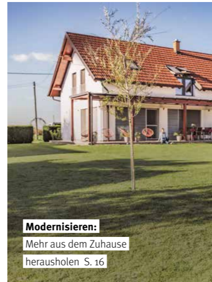
Modernisieren: Mehr aus dem Zuhause herausholen S. 16