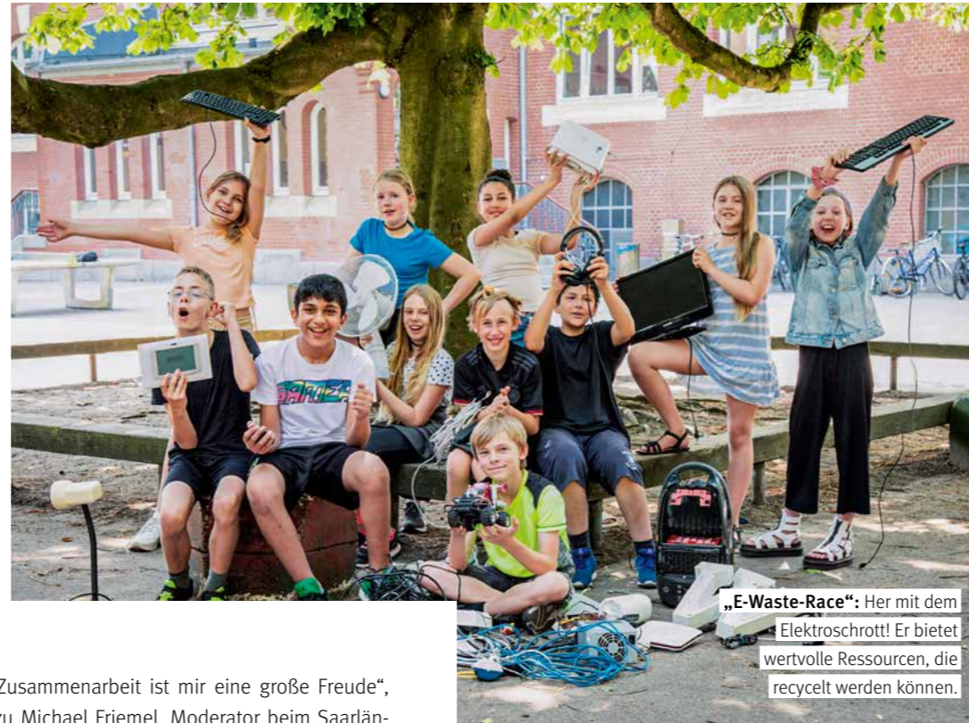
„E-Waste-Race“: Her mit dem Elektroschrott! Er bietet wertvolle Ressourcen, die recycelt werden können.

net wurden. Der NachhaltigkeitsKompass ist ein etabliertes Steuerungs- und Bewertungsinstrument für professionelles Nachhaltigkeitsmanagement in Regionalbanken. Ausgezeichnet werden nur Institute, die zum Bewertungsstichtag (31.12.2025) zu den besten zehn Prozent gehören. Mehr unter sparda-sw.de/nachhaltigkeit