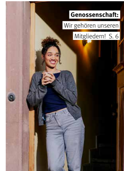
Genossenschaft: Wir gehören unseren Mitgliedern! S. 6