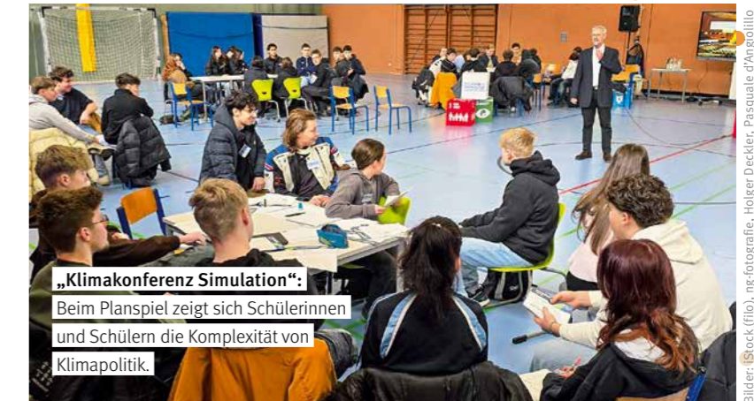
„Klimakonferenz Simulation“: Beim Planspiel zeigt sich Schülerinnen und Schülern die Komplexität von Klimapolitik.