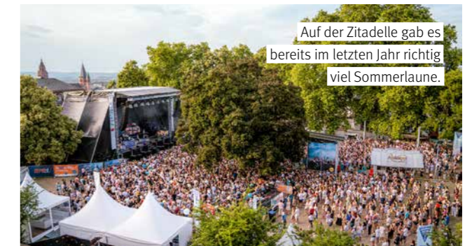
Auf der Zitadelle gab es bereits im letzten Jahr richtig viel Sommerlaune.