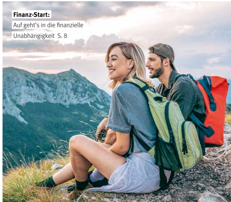
Finanz-Start: Auf geht's in die finanzielle Unabhängigkeit S. 8

EIN INVESTMENT IN GOLD KANN SINNVOLL SEIN. WIR BERATEN SIE GERN ZU IHREN MÖGLICHKEITEN.