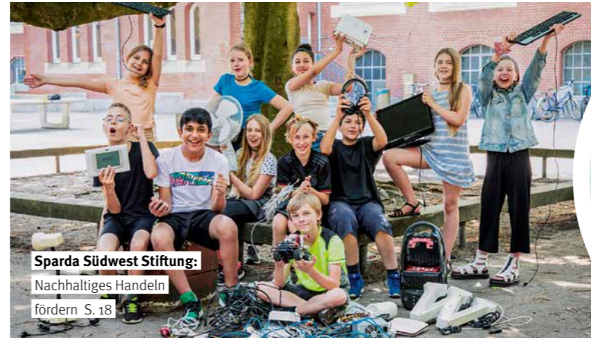
Sparda Südwest Stiftung: Nachhaltiges Handeln fördern S. 18