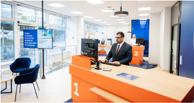
Berliner Volksbank Filiale in Berlin-Prenzlauer Berg