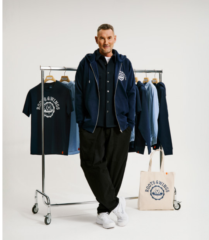
Jubiläums-Kollektion der Berliner Volksbank designed by MICHALSKY

Den Auftakt bildete die Birthday Week ab dem 19. Januar 2026 an allen Standorten und im Quartier Berliner Volksbank. Gleichzeitig übernehmen wir Verantwortung in der Region: Auf Veranstaltungen sammeln wir Spenden zur Anschaffung eines barrierefreien Kleinbusses für die Pfefferwerk Stadtkultur gGmbH