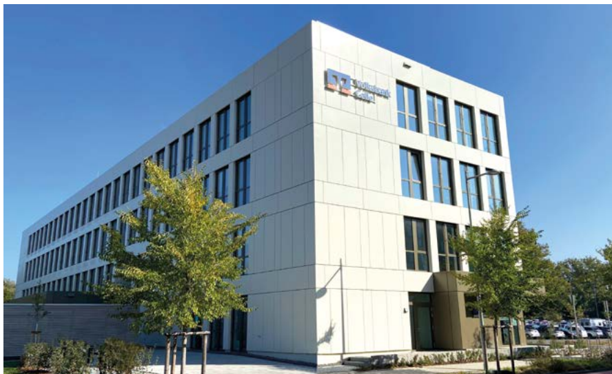
Das neue Bürogebäude für Firmenkunden, Private Banking und Baufinanzierung auf der Allerinsel

Die Volksbank Celler, Niederlassung der Hannoverschen Volksbank, hatte es im Mai bereits angekündigt, am 1. Dezember war es nun so weit: sie hat die Stechbahn verlassen und dafür zwei neue Standorte bezogen.