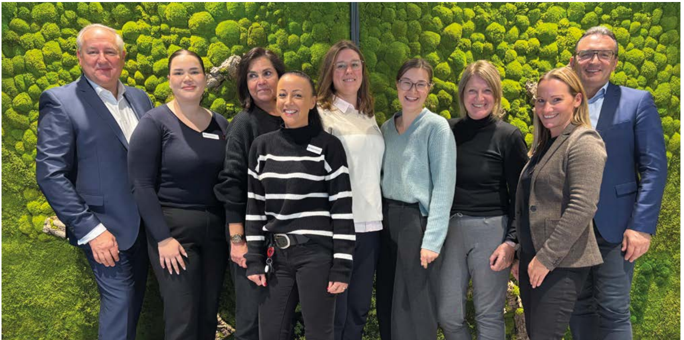
Motiviert und gut gelaunt sind sechs neue Mitarbeiterinnen in das Trainingscamp gestartet

Mit dem Start eines Trainingscamps begann am 1. Oktober bei der Hannoverschen Volksbank für sechs Quereinsteigerinnen eine strukturierte und praxisnahe Qualifizierungsphase zur Kundenassistentenz. Ziel des Programms ist es, die Teilnehmerinnen systematisch auf ihre zukünftige Tätigkeit im Privatkundengeschäft vorzubereiten.