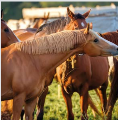
und Impfungen für Schulpferde in Otternhagen

Der Clou: Die Hannoversche Volksbank trägt selbst mit zum Erfolg der Crowdfunding-Aktionen bei. Damit nämlich möglichst viele gute Ideen realisiert werden können, bezuschusst sie Projekte in der Finanzierungsphase durch zusätzliche Spendengelder. Für jede Unterstützerin und jeden Unterstützer, die/der mindestens 10 Euro spendet, gibt die Volksbank 10 Euro dazu. Einrichtungen, die eine Mitgliedschaft bei der Hannoverschen Volksbank besitzen bzw. abschließen, erhalten zudem ein Startkapital in Höhe von 10 % der Projektsumme. So stammen gut 4.000 der bei den drei beschriebenen Projekten gesammelten 13.000 Euro aus dem Spendentopf der Hannoverschen Volksbank.