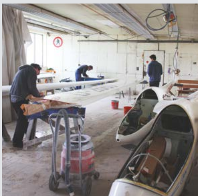
energetische Dachsanierung bei der Akademischen Fliegergruppe