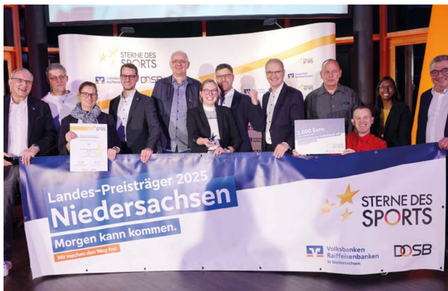
Große Freude beim AthletikSportVerein Wunstorf Südaue e. V. über die Auszeichnung