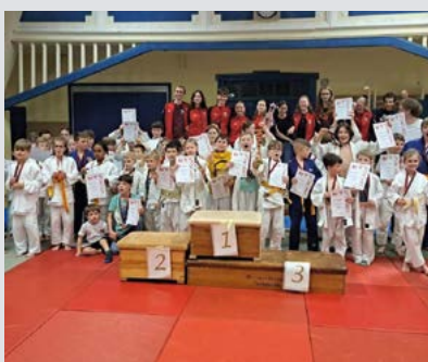
Neue Judomatten für den TKJ Sarstedt,