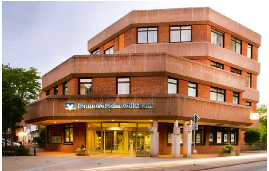
Ende 2026, Anfang 2027 nur noch Geschichte – der alte Standort in der Wunstorfer Straße

Die neuen Räumlichkeiten werden modern gestaltet und bieten eine einladende Atmosphäre. In den neuen Beratungszimmern legt die Hannoversche Volksbank besonderen Wert auf Discretion und Privatsphäre. Jedes Beratungszimmer ist so konzipiert, dass es