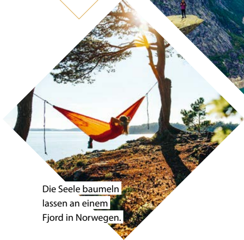
Die Seele baumeln lassen an einem Fjord in Norwegen.