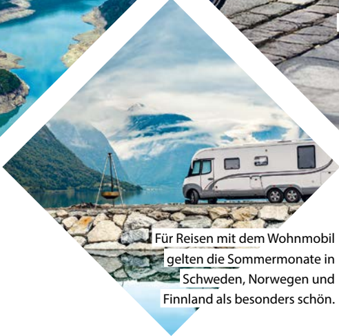
Für Reisen mit dem Wohnmobil gelten die Sommermonate in Schweden, Norwegen und Finnland als besonders schön.

Zu gewinnen: 2 x 100 Euro und 4 x 50 Euro