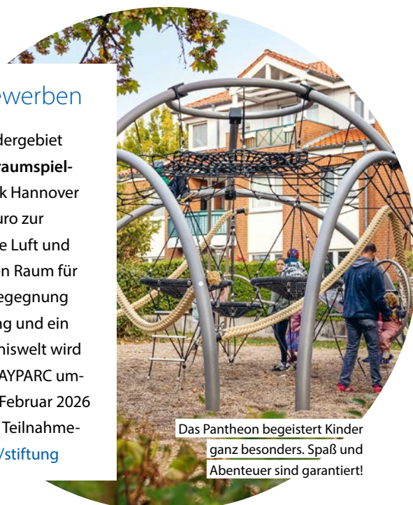
Das Pantheon begeistert Kinder ganz besonders. Spaß und Abenteuer sind garantiert!