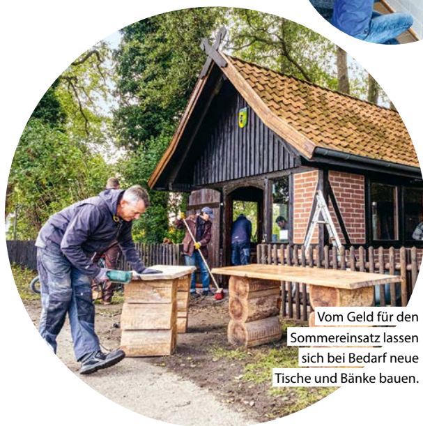
Vom Geld für den Sommereinsatz lassen sich bei Bedarf neue Tische und Bänke bauen.