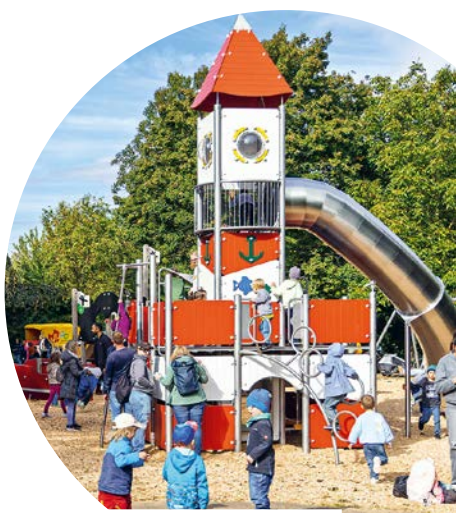
Der Leuchtturm samt Röhrenrutsche ist ein besonderes Highlight des Traumspielparks 2025 in Gehrden.

Städte, Gemeinden und Vereine aus dem Fördergebiet haben auch 2026 wieder die Chance, einen Traumspielpark zu gewinnen. Die STIFTUNG Sparda-Bank Hannover stellt dafür eine Fördersumme von 150.000 Euro zur Verfügung. Denn fest steht: Bewegung, frische Luft und kreative Spielmöglichkeiten – Kinder brauchen Raum für ihre Entwicklung. Das Ziel ist, einen Ort der Begegnung zu schaffen, der sozialen Austausch, Bewegung und ein friedliches Miteinander stärkt. Die neue Erlebniswelt wird gemeinsam mit dem Spielgerätehersteller PLAYPARC umgesetzt. Bewerbungen sind noch bis zum 28. Februar 2026 möglich. Alle Details dazu sowie die genauen Teilnahmebedingungen gibt es unter www.sparda-h.de/stiftung