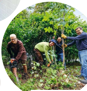
Förderungswürdig sind auch dringend notwendige Gartenarbeiten auf dem Vereinsgelände.