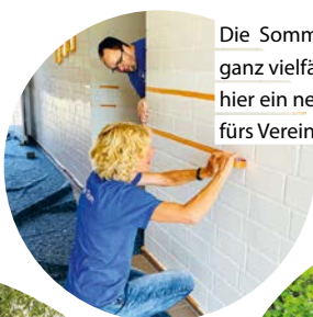
Die Sommereinsätze können ganz vielfältig aussehen – hier ein neuer Anstrich fürs Vereinsheim.