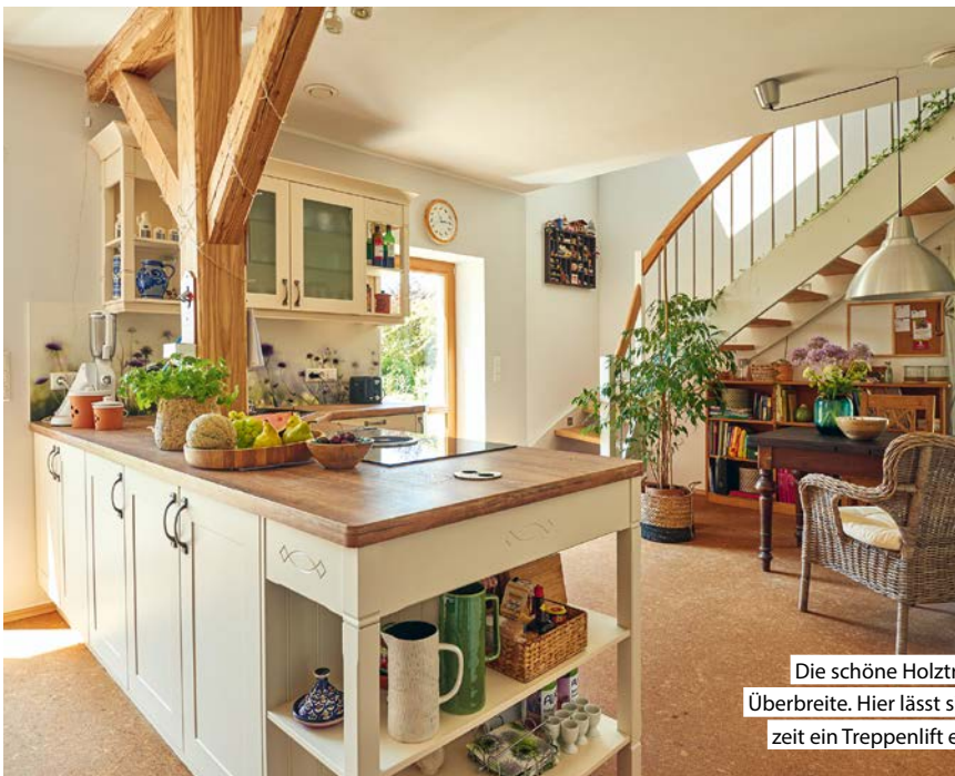
Die schöne Holzterasse hat Überbreite. Hier lässt sich jederzeit ein Treppenlift einbauen.