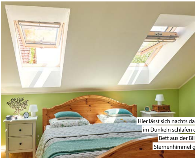
Hier lässt sich nachts dank Rollos im Dunkeln schlafen oder vom Bett aus der Blick in den Sternenhimmel genießen.

Sie möchten ein persönliches Beratungsgespräch? Vereinbaren Sie einfach einen Termin unter www.sparda-h.de/termin