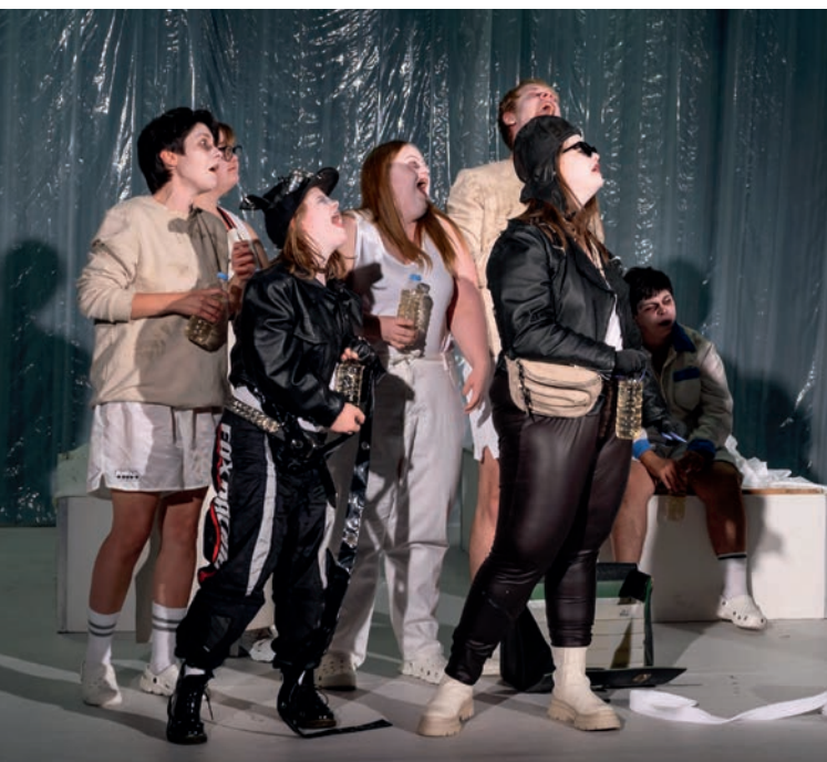
Das Ensemble in Aktion