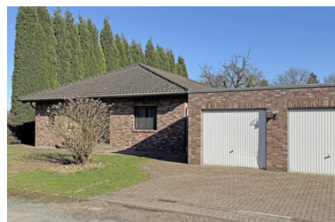
Bungalow in Voerde-Spellen mit beeindruckendem Gartenareal!