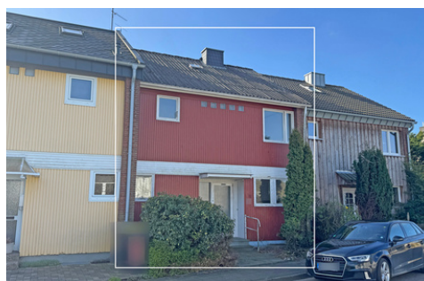
Ihr neues Zuhause mit Charakter: Gestalten Sie Ihr persönliches Wohnparadies!