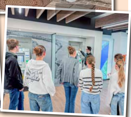
Eindrücke von unseren Praktikumsstagen: Gemeinsam mit den Schülern erkundeten wir unsere Hauptgeschäftsstelle in Donauwörth. Ob beim exklusiven Blick hinter die Kulissen unserer Geldautomaten, der schokoladigen Überraschung im Tresor oder dem Ausprobieren unserer digitalen Beratung – unsere jungen Gäste konnten hautnah erleben, wie abwechslungsreich die Arbeit in unserer Bank ist.

Infos und Bewerbung unter: www.rvb-donauwoerth.de/ karriere