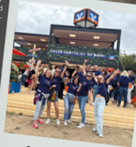
San Hejmo 2025

Ein sichtbares Zeichen des Zusammenhalts der Heimatbanker sind auch die neuen T-Shirts und Hoodies für unsere Mitarbeitenden. Sie stehen nicht nur für ein einheitliches Auftreten nach außen, sondern vor allem für ein starkes Wir-Gefühl nach innen. Ob bei Veranstaltungen oder sogar bei gemeinsamen Feiern, wie im Sommer letzten Jahres beim San Hejmo Festival.