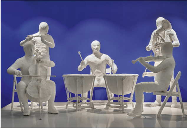
Quintett aus dem Orchestra sans Musica