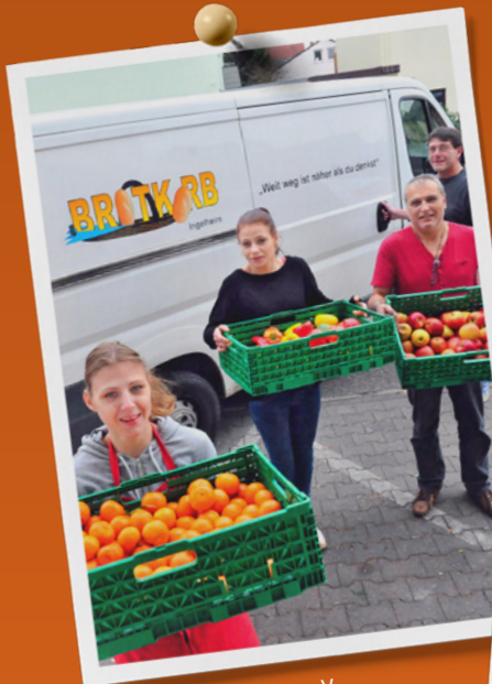
Caritas Verband Mainz e. V.