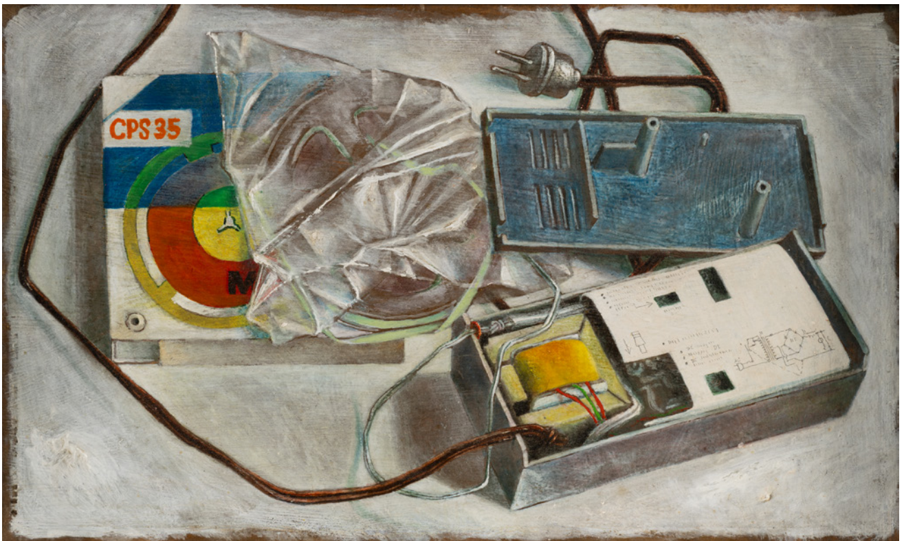
Petra Flemming, „Tonbandstilleben“, 1969.