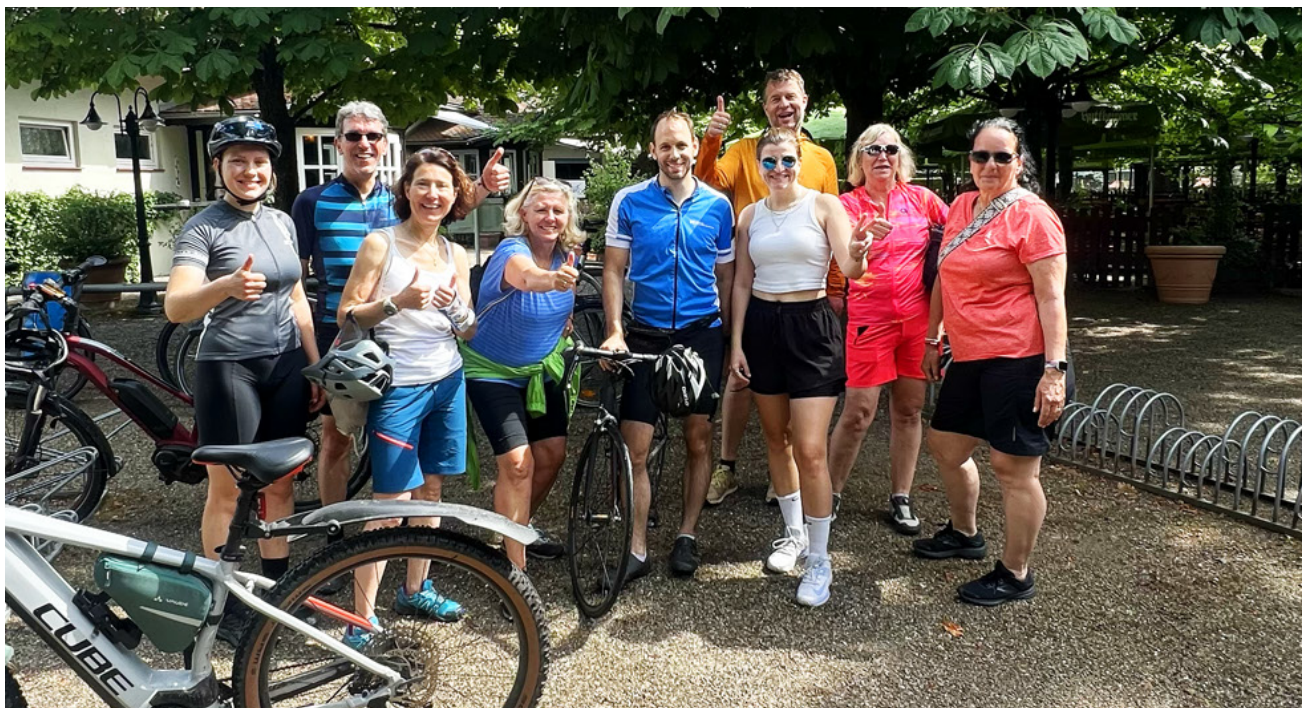
Auch am Wochenende ein starkes Team: Kolleginnen und Kollegen sind samstags zum Kilometersammeln gemeinsam geradelt.

Die erfolgreiche Teilnahme am Stadtradeln zeigt eindrucksvoll, wie gemeinsames Engagement positive Impulse für Beschäftigte, Umwelt und Gesellschaft setzen kann.