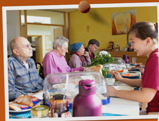
Hospiz-Verein Bergstraße e. V.