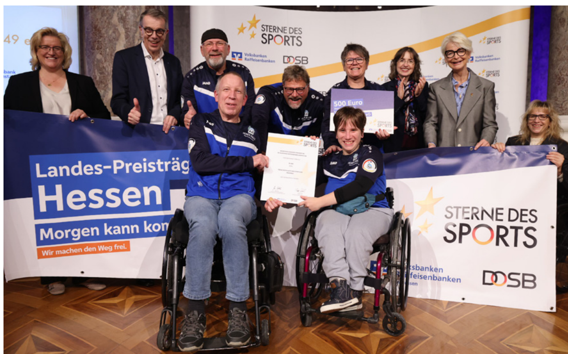
Die „Heiner-Rollis“ bei der Verleihung des Sonderpreises

Alle Sportvereine in unserem Geschäftsgebiet können sich ab dem 1. April 2026 für die nächste Runde der Sterne des Sports bewerben. Mitmachen lohnt sich: Auf lokaler Ebene gibt es bis zu 2.000 Euro zu gewinnen. Insgesamt winken den teilnehmenden Vereinen bis zu 14.500 Euro für die Vereinskasse.