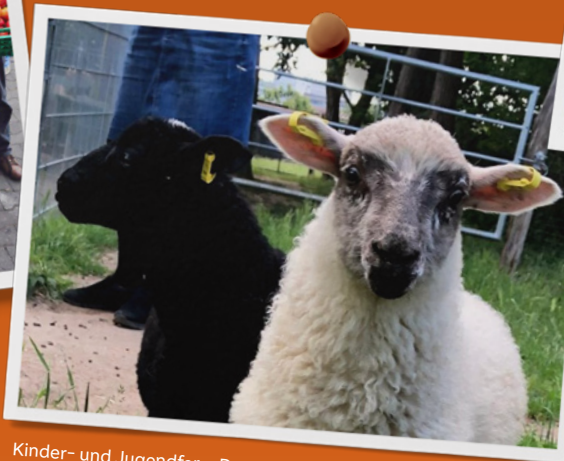
Kinder- und Jugendfarm Darmstadt e. V.