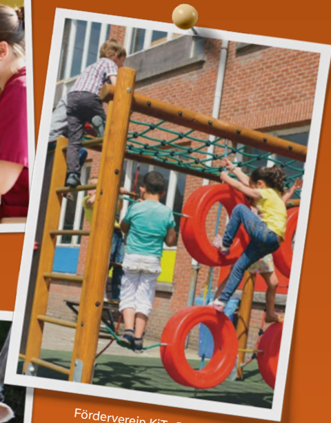
Förderverein KiTa Ruthsenbach e. V.