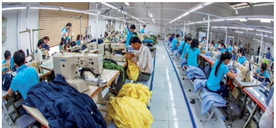
Die Textilindustrie in Vietnam ist ein weltweit führender Sektor, der 2024 Exporte von rund 44 Mrd. Dollar erzielte.

Allein Elektronik und Komponenten machten 2024 über ein Drittel der Warenexporte aus und erzielten ein Rekordvolumen von 126,5 Milliarden US-Dollar. Dieser Boom wird durch große ausländische Direktinvestitionen (FDI) angeheizt, vor allem aus Südkorea, Singapur, Japan, China, den USA und Taiwan. 2024 verzeichnete Vietnam 38,2 Milliarden US-Dollar an neuen und zusätzlichen FDI Zusagen.