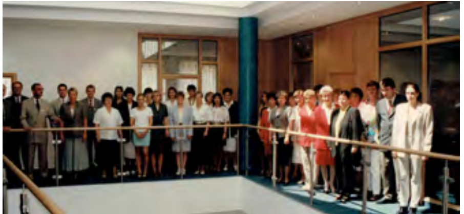
Eröffnung der neuen Geschäftsstelle