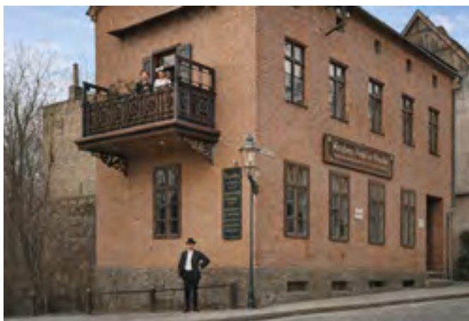
Bankgeschäft des Vorschuss-Vereins in der Stettiner Str.1 (1896 - 1912)