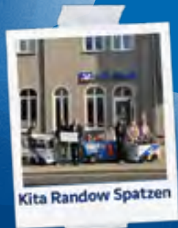
Kita Randow Spatzen