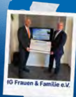
IG Frauen & Familie e.V.