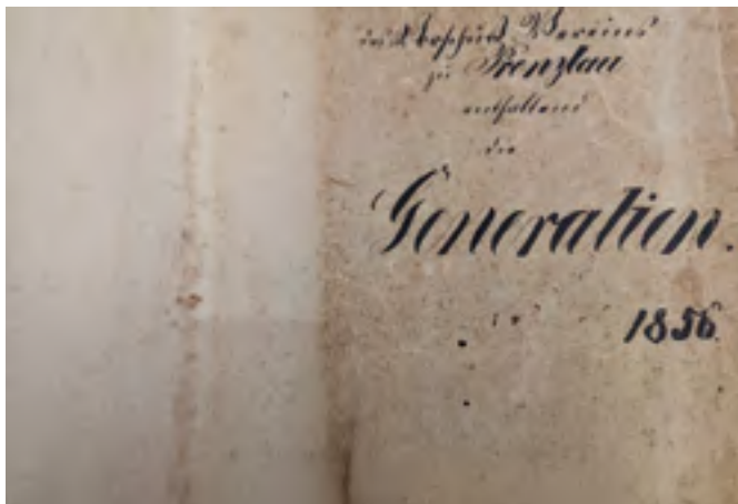
Deckel der Gründungsakte des Vorschuss-Vereins (1856), Stadtarchiv Prenzlau