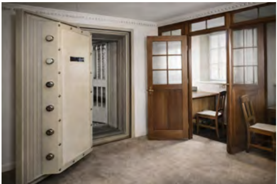
Blick in den Tresorraum.