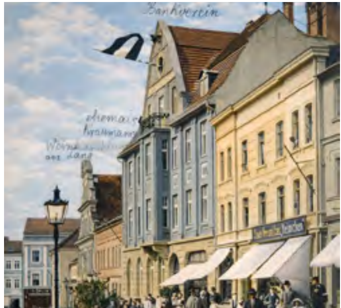
Sitz des Bankvereins in der Scharnstraße

Der Vorschuss-Verein Prenzlau zählte bereits vier Monate nach seiner Gründung 76 Genossenschaftsmitglieder. Von 1856 bis 1870 wurde der Verein durch einen 12-köpfigen Vorstand geleitet (Vorsitzender, Kontrolleur, Kassierer, Schriftführer und acht Beisitzer). 1870 wurde der Vorstand auf drei Personen (Direktor, Kontrolleur und Kassierer) beschränkt. An die Stelle der Beisitzer trat als Kontrollorgan ein achtköpfiger „Ausschuss“, der seit 1889 den Namen „Aufsichtsrat“ führte. Der Prenzlauer Vorschussverein hatte seinen Sitz zunächst in der Klosterstraße 9. Erst am 17. Februar 1896 hatte der Verein ein eigenes Gebäude in der Stettiner Str. 1 angekauft und hier ab dem 01.10.1896 ein Bankgeschäft mit Schalterverkehr eröffnet. Nachdem der Platz hier nicht mehr ausreichte, kaufte man 1910 in der Scharnstraße ein Grundstück an, wo 1911 bis 1912 ein repräsentatives Bankgebäude errichtet wurde, das am 9. September 1912 seiner Bestimmung übergeben wurde. Im 19. Jahrhundert war der Vorschussverein ein wichtiger Faktor zur Stärkung lokaler Kleinunternehmer und Handwerksbetriebe. Zwischen 1856 und 1868 konnte der Verein beträchtliche Zugewinne an Mitgliedern von 79 auf 489 verbuchen.