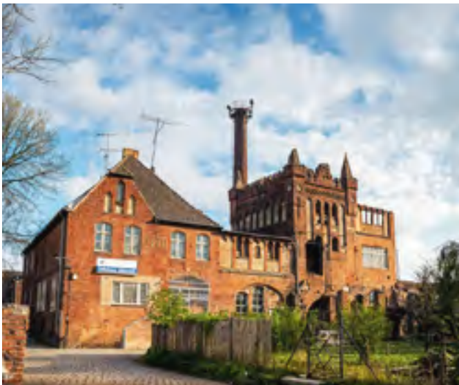
In der alten Margarinefabrik war die Volksbank bis 1997 ansässig.