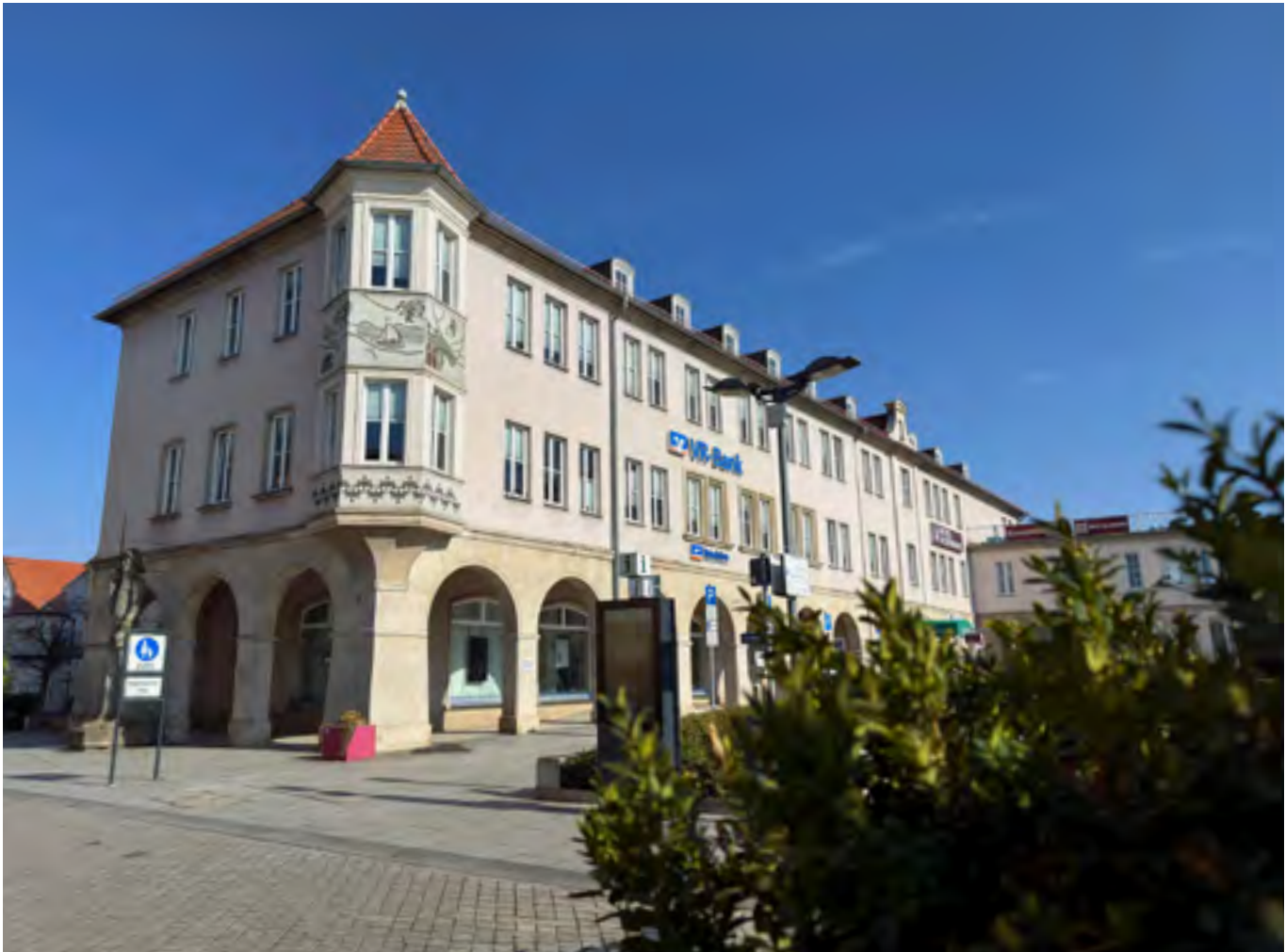
Die Hauptstelle der VR-Bank Uckermark-Randow eG ist seit 1997 in der Friedrichstraße 2a

Wachstum, Filialnetzausbau, technische Modernisierung und regionale Fusionen gingen dabei stets mit dem Anspruch einher, Nähe zur Kundschaft zu wahren und Verantwortung für die Region zu übernehmen. Das kontinuierliche Engagement für kommunale, soziale und kulturelle Projekte unterstreicht diesen Anspruch bis in die Gegenwart. Mit der aktuellen Organisationsstruktur, einer stabilen wirtschaftlichen Basis und einer klaren regionalen Ausrichtung setzt die VR-Bank Uckermark-Randow eG die Tradition genossenschaftlichen Bankwesens fort. Ihre Geschichte zeigt exemplarisch, wie sich ein regional verwurzelt Institut über Generationen hinweg behaupten und weiterentwickeln kann.