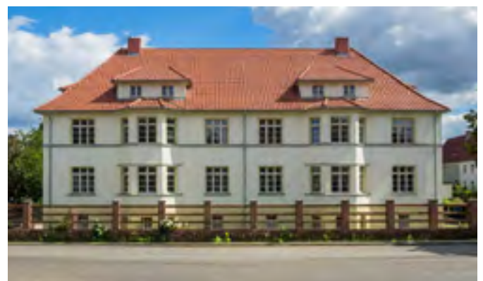
Sitz der Volksbank Prenzlau eG mbH in der Brüssower Str. 55a.

Gemäß Befehl der Sowjetischen Militäradministration vom 15. Januar 1946 hatte die Volksbank Prenzlau e.G.m.b.H. ihre Tore in einer zugewiesenen Wohnung in der Brüssower Straße 55a wieder geöffnet. Nach kurzer Zeit musste sie dort wieder ausziehen und erhielt ein kleines Zimmer im Haus der Bürgermeisterei. Die Volksbank beschwerte sich über diesen unhaltbaren Zustand. Die alten Räume wurden zum 23.09.1946 wieder freigegeben. Später bezog die Volksbank Räumlichkeiten in der ehemaligen Margarinefabrik. 1974 wurde die Volksbank zur „Genossenschaftskasse“, was den veränderten Rahmenbedingungen im sozialistischen Wirtschafts- und Finanzsystem Rechnung trug.