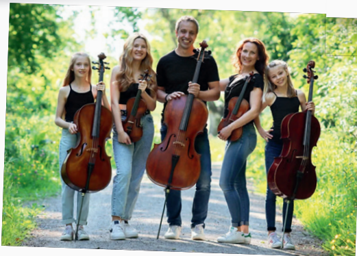
Beatlestrings Family Sound von Klassik bis Pop