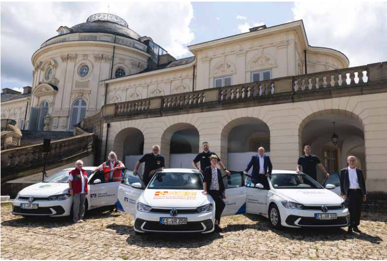
Fahrzeugübergabe auf Schloss Solitude – drei VRmobile für soziale Einrichtungen in der Region.