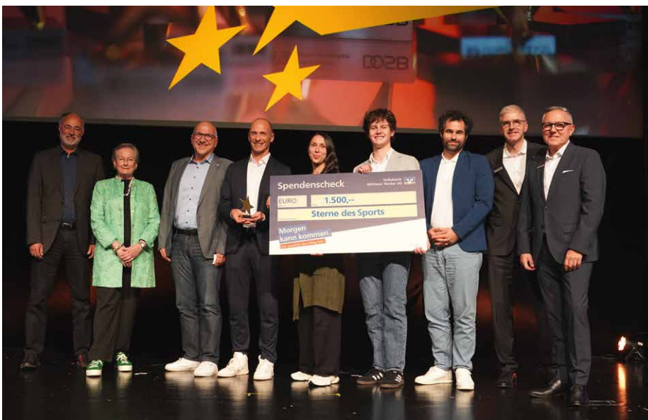
Den Großen Stern des Sports in Bronze haben wir 2025 an die Esslinger Vereine TV Liebersbronn und TV Hegensberg vergeben.

Übrigens: Auch im Jahr 2026 stellen wir 150.000 Euro sowie einen zusätzlichen Bonus in Höhe von 20.000 Euro für Bewegungsprojekte bereit.