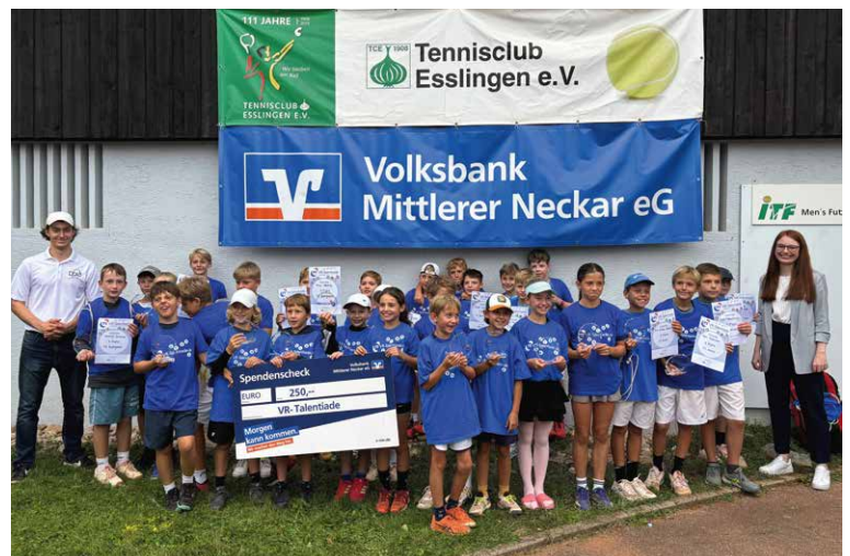
Nachwuchsförderung in der Region: VR-Talentiade beim TC Esslingen im September 2025.

Auch wir unterstützen die VR-Talentiade seit vielen Jahren aktiv und leisten damit einen Beitrag zur nachhaltigen Nachwuchsförderung im regionalen Nachwuchssport. Allein im Jahr 2025 wurden mehr als zehn Veranstaltungen in unserem Geschäftsgebiet durchgeführt, bei denen Kinder und Jugendliche ihre Fähigkeiten ausprobieren und weiterentwickeln konnten.