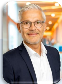
Patrick Walter Firmenkunden