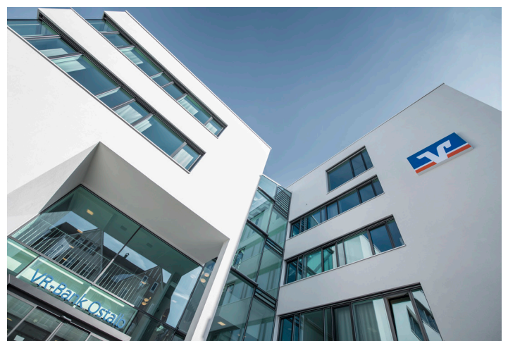
Die VR-Bank Ostalb wurde 2026 mit dem Prädikat „SEHR GUT in der Baufinanzierung“ ausgezeichnet.

Das Resümee zum Beratungsgespräch lautet deshalb: sehr gut!