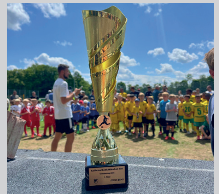
1. Raiffeisenbank München-Süd Cup, 12.07.2025 – 13.07.2025