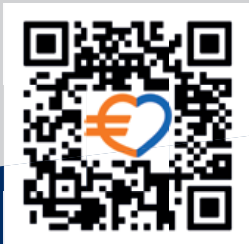
Zu unseren Karten