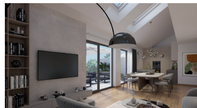
Beispielansicht Bauprojekt AXIA Bauprojekt GmbH in Forstenried

Laut einer Analyse von Sprengnetter verteuerten sich Eigentumswohnungen bundesweit im März 2025 um 0,2 % gegenüber dem Vormonat. Auf Jahressicht beträgt das Plus sogar 4,1 %. In München liegt der Zuwachs bei Eigentumswohnungen bei 3,5 %, Einfamilienhäuser verteuerten sich um 2,3 %. Damit zeigt sich: Trotz aller Unsicherheiten bleibt München ein stabiler Markt mit moderaten Preissteigerungen.