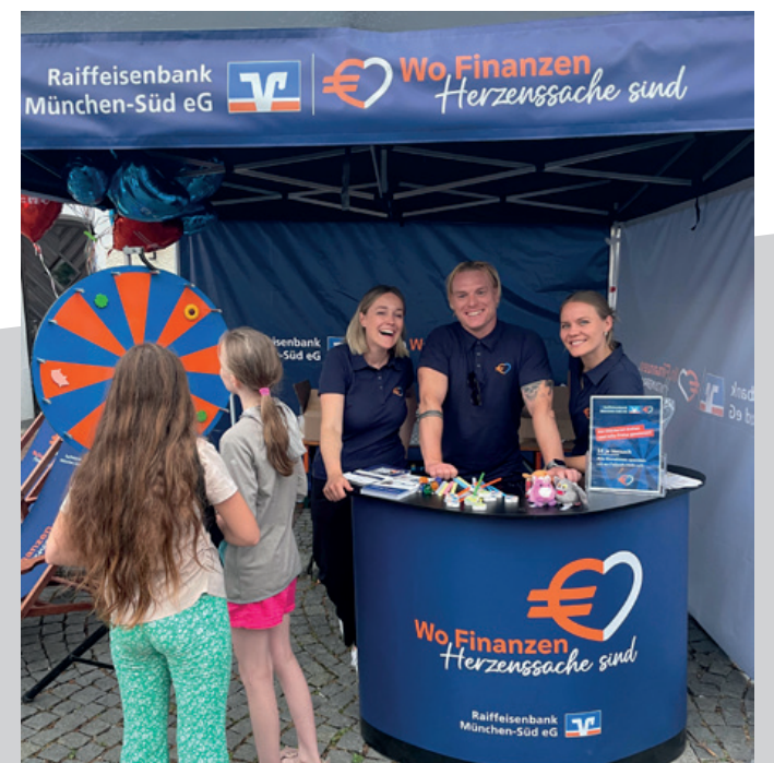
Deutsch-Französisches Freundschaftsfest Pullach, 27.06.2025 – 29.06.2025