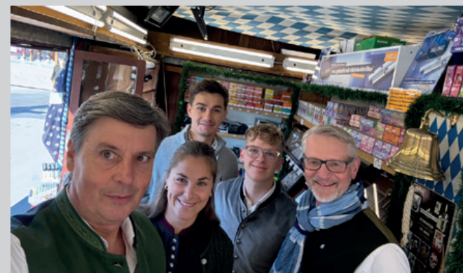
Crew des Tabakstands auf dem Oktoberfest