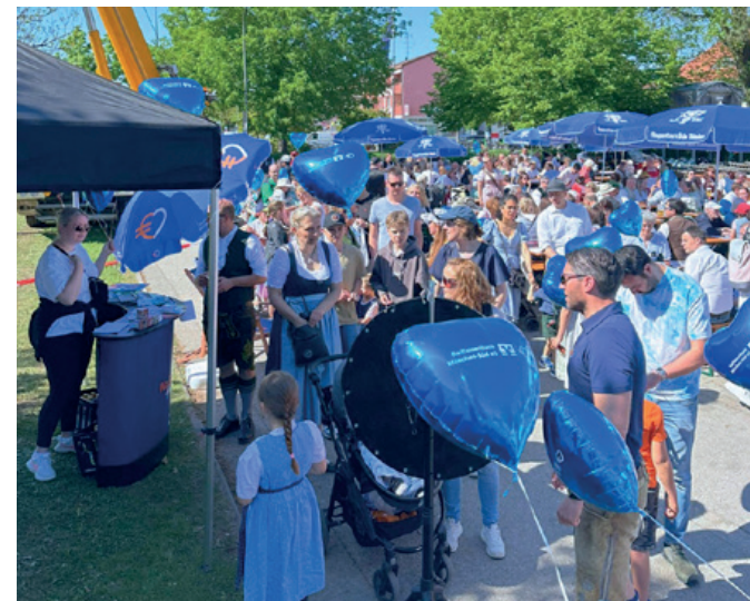
Maifest Neuried, 01.05.2025

Alle Veranstaltungen waren ein voller Erfolg – dank Ihnen! Ihre Teilnahme, Ihr Interesse und Ihre Gespräche machen diese Events zu etwas Besonderem. Wir freuen uns schon jetzt auf viele weitere gemeinsame Erlebnisse im kommenden Jahr.