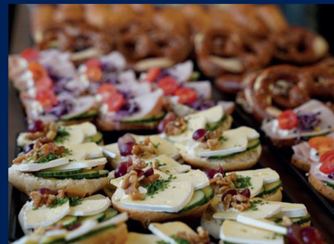
Verpflegung von Café Vorort Neuried