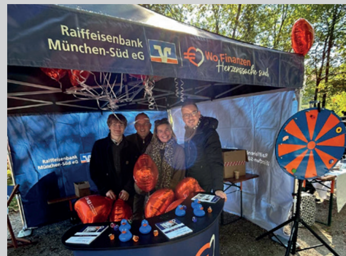
Pullacher Entenrennen, 03.10.2025