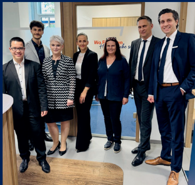
Kundenveranstaltung „Rund um die Immobilie“ Neuried

Ob beim fröhlichen Entenrennen in Pullach, dem stimmungsvollen Deutsch-Französischen Freundschaftsfest, dem traditionellen Maifest in Neuried oder sportlichen Highlights wie dem TSV Solln Raiffeisenbank München-Süd Cup und dem Kindergartencup in Neuried – wir waren mit Begeisterung dabei! Diese Veranstaltungen boten uns die Gelegenheit, mit vielen Menschen ins Gespräch zu kommen, Kinderaugen zum Leuchten zu bringen und unsere regionale Verbundenheit zu zeigen.