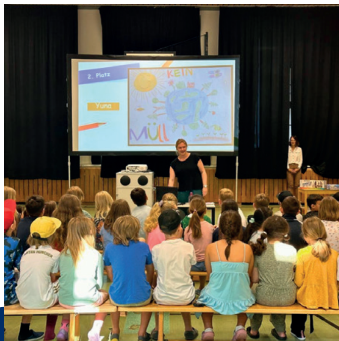
Siegerehrung Malwettbewerb in der Grundschule Boschetsrieder Straße

Damit Kinder auch frühzeitig den verantwortungsvollen Umgang mit Geld lernen, gibt es bei uns das PRIMAX-Taschengeldkonto . Dieses kostenlose Girokonto bietet Kindern die Möglichkeit, spielerisch und sicher erste Erfahrungen mit dem Thema Finanzen zu sammeln – ganz ohne Risiko und mit viel Spaß.