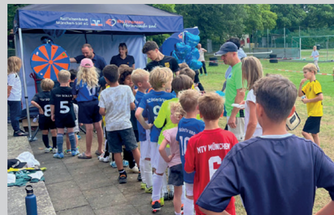
1. Raiffeisenbank München-Süd Cup, 12.07.2025 – 13.07.2025