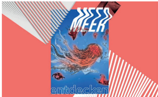
Motto jugend creativ 2025/2026

Ein echtes Highlight ist der Internationale Jugendwettbewerb „jugend creativ“ , der jedes Jahr Kinder und Jugendliche dazu einlädt, sich künstlerisch mit wichtigen gesellschaftlichen Themen auseinanderzusetzen. In der 56. Runde lautete das Motto „Meer entdecken“. Zwei Schulen aus unserer Region – die Grundschule Forstenrieder Allee und die Grundschule in der Boschetsrieder Straße – haben sich beteiligt und beeindruckende Werke eingereicht. Die besten Beiträge werden von uns mit tollen Preisen belohnt. Wir sind begeistert von der Kreativität und dem Engagement der jungen Künstlerinnen und Künstler!