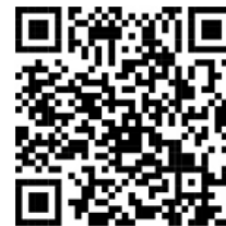
VR Banking App für Android und iOS (iPhone)

Wenn Sie einen TAN-pflichtigen Auftrag wie eine Überweisung in der neuen VR Banking App durchführen, erhalten Sie zur Freigabe eine Push-Nachricht in die VR SecureGo plus App. Bitte prüfen Sie die in der Push-Nachricht angezeigten Daten auf Richtigkeit. Danach können Sie den Vorgang mit dem von Ihnen gewählten Freigabecode, bei dem es sich zum Beispiel um ein Biometrie-Merkmal handeln kann, autorisieren. Im Anschluss erhalten Sie eine Bestätigung. Und schon ist die Überweisung erledigt.