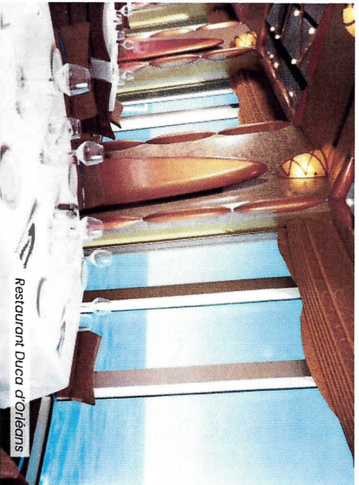
Restaurant Duca d'Orléans

• 9 Restaurants, darunter 5 Thementaurants: das Restaurant Archipelago, das Teppanyaki, das Sushino at Costa, die Pizzeria Piumid'Orò, das The Salty Beach Street Food (Thementaurants gegen Gebühr und z.T. mit Reservierung) • 9 Bars, davon 4 Themenbars: die Aperol Spritz Bar, die Sunset Bar, die Wine Bar und die Gelateria Amarillo.