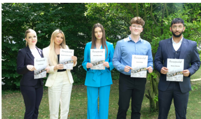
Azubis der Volksbank Köln Bonn mit ihren Urkunden zur Baumpatenschaft

Alle Azubis, die ihre Ausbildung bei der Volksbank Köln Bonn starten, erhalten eine Urkunde für eine Baumpatenschaft. Die Bank pflanzt für jeden neuen Azubi einen weiteren Baum in einem der drei Volksbank-Wälder und schafft somit von Beginn an ein Bewusstsein für die nachhaltige Ausrichtung der Bank.