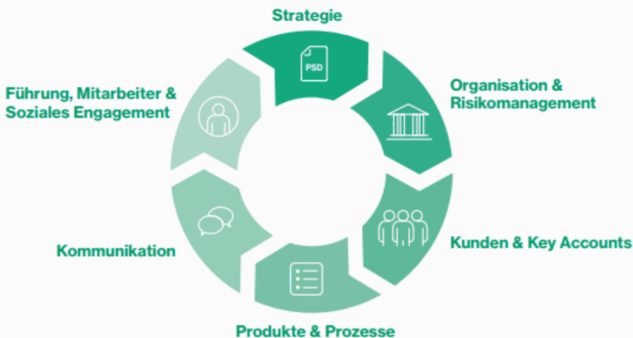
Abb.: Die sechs Handlungsfelder des Nachhaltigkeitsmanagements der PSD Bank West eG

Sie geben einen Orientierungsrahmen für eine übergeordnete Zielsetzung zur nachhaltigen Entwicklung unserer Bank und werden durch Zielformulierungen und entsprechende Maßnahmen konkretisiert. So ist sichergestellt, dass wir uns bei der Planung unserer nachhaltigen Maßnahmen intensiv mit allen Handlungsfeldern beschäftigen.