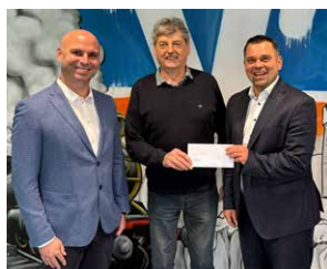
1. FC Hedersdorf 1945