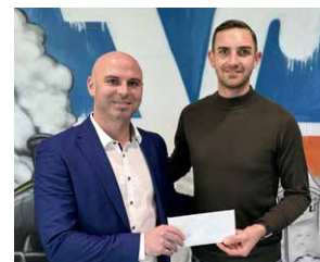
1. FC Schnaittach