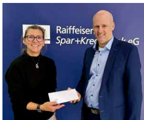
TV 1877 Lauf