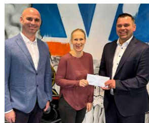
SV Osterhohe 1951