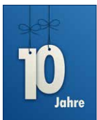
10 Jahre #teamvoba Frauke Würger Reinigungskraft