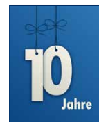
10 Jahre #teamvoba Bärbel Zachow Reinigungskraft