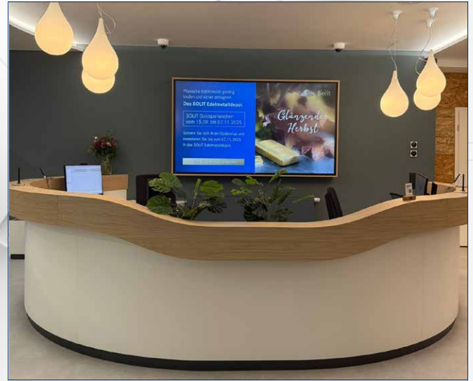
Unser Empfangsbereich im neuen Design.

Herzstück des neuen Konzepts ist die klare Trennung zwischen Arbeitswelten und Beratungswelten. Diese Aufteilung wurde erstmals in einer unserer Filialen umgesetzt und markiert einen wichtigen Schritt in der Weiterentwicklung unseres Filialnetzes.