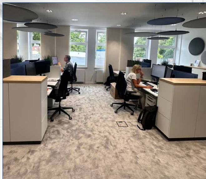
Einblick in unsere neuen Arbeitswelten.

Während die Arbeitsbereiche unseren Mitarbeitenden Raum für konzentriertes und effizientes Arbeiten bieten, sind die Beratungswelten ganz auf persönliche Gespräche ausgerichtet. So entsteht eine vertrauensvolle Atmosphäre für Finanzgespräche, die angenehm, professionell und diskret ist.