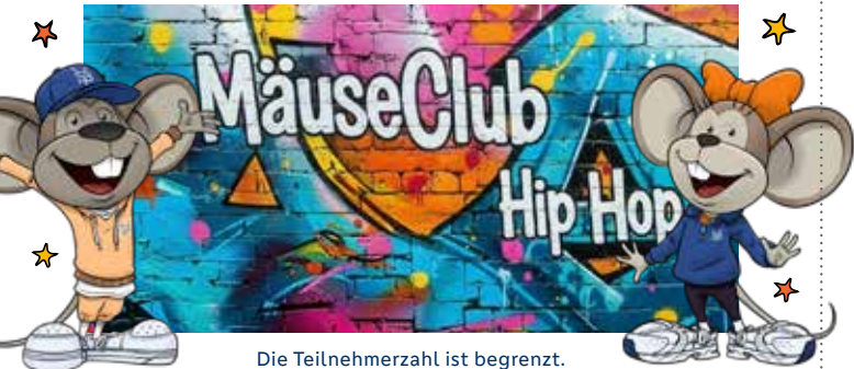
Die Teilnehmerzahl ist begrenzt.

Einfach anmelden unter: volksbanking.de/hiphop Nicht vergessen: Die Zahl der Plätze ist begrenzt und du hast erst einen Platz, wenn du eine Bestätigung von Hanni und Manni bekommen hast.