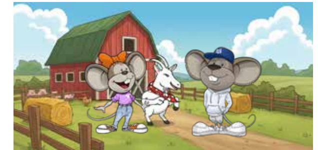
Die Teilnehmerzahl ist begrenzt.

Einfach anmelden unter: volksbanking.de/farm Wichtig: Die Zahl der Plätze ist begrenzt und du hast erst einen Platz, wenn du eine Bestätigung von Hanni und Manni bekommen hast.