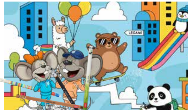
Nur solange der Vorrat reicht.

Bring einfach den Coupon im Mai in deine Filiale oder zeig ihn digital auf dem Smartphone vor und hol dir deinen Legami-Stift bei uns ab.