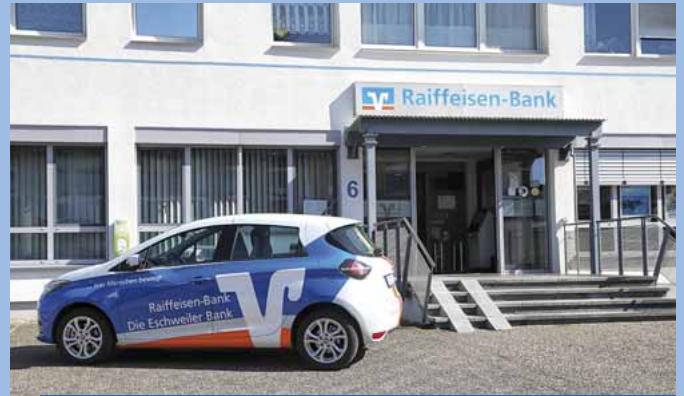
■ Kinzweiler | Pannesstraße 6 | 02403 799-111