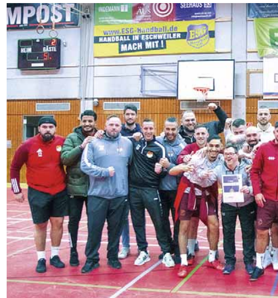
Sieger des 28. Raiffeisen-Cup: SV Falke Bergrath