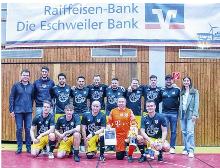
Sieger des 25. Fuchs-Cup: SC Berger Preuß II

Mehr als nur Sport: Unser jährliches Fußballturnier zwischen den Tagen ist ein Fest des Zusammenhalts, bei dem Gemeinschaft und Teamgeist im Mittelpunkt stehen. Jeder Kick erzählt eine Geschichte von Freund- und Leidenschaft, die unsere Tradition lebendig hält.