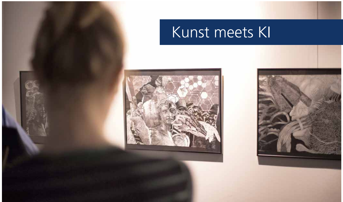
Remember the Human: Mensch & Technik im Fokus - Kunstausstellung der Bischöflichen Liebfrauenschule Eschweiler der Jahrgangsstufen EF + Q1