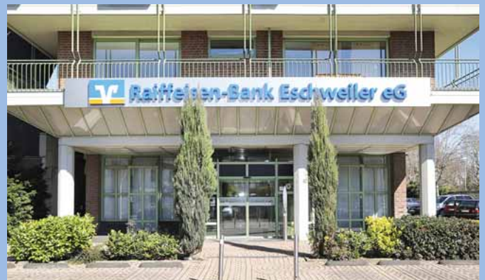
■ Dürwiß | Jülicher Straße 160 | 02403 799-121