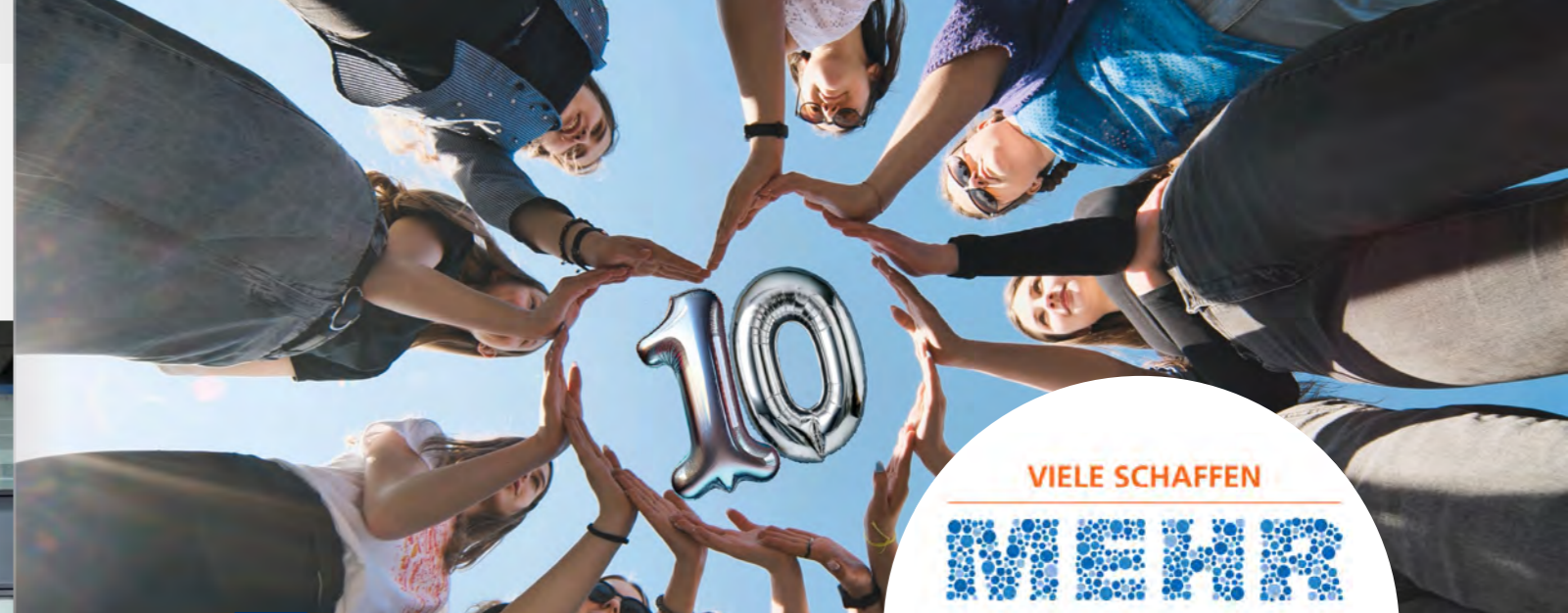
VRbunden – durch zehn Jahre gelebtes Miteinander