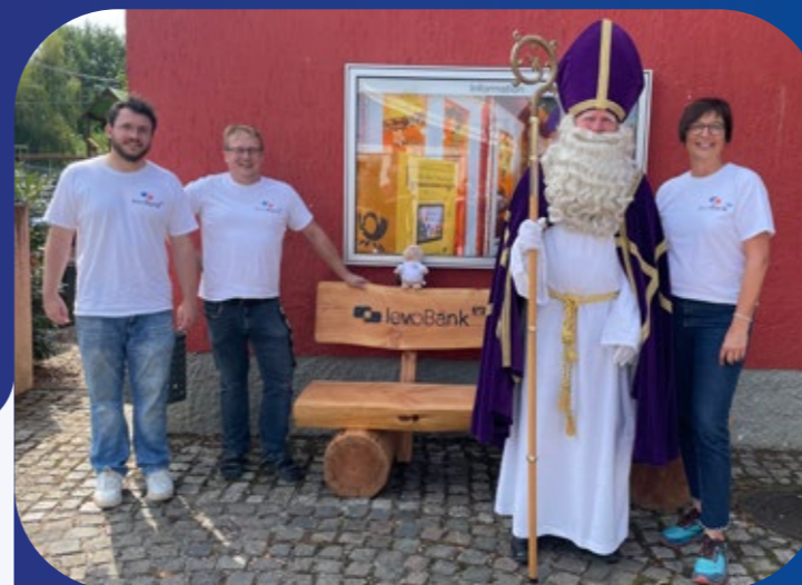
Nikolauspostamt St. Nikolaus Großrosseln