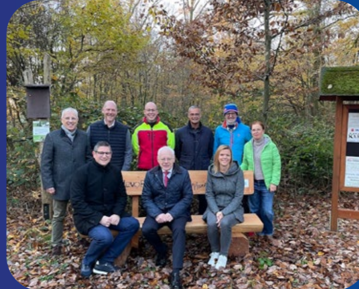
Lauftreff Theeltal Lebach

Wir sind begeistert von den bisherigen Einsendungen und freuen uns auf viele weitere Lieblingsplätze in unserer Region. Gemeinsam setzen wir ein buntes Zeichen für Gemeinschaft, Begegnung und Heimat – ganz im Sinne von 130 Jahren levoBank – Eure Lieblingsbank.