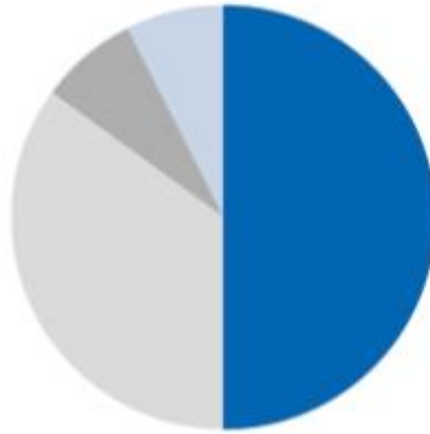
GB Invest ausgewogen