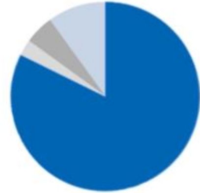
GB Invest offensiv