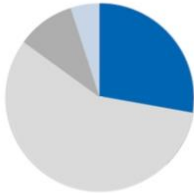
GB Invest defensiv