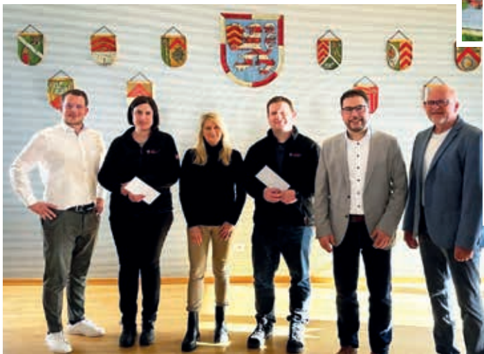
Spendenübergabe an die First Responder