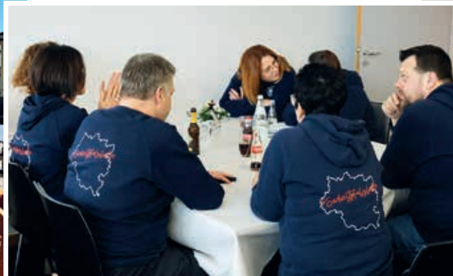
Neujahrsempfang mit Südwestpfalzliebe