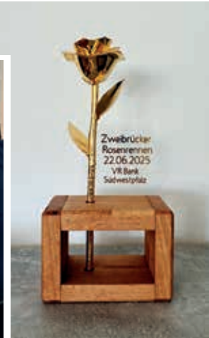
Rosenpreis für das Zweibrücker Pferderennen