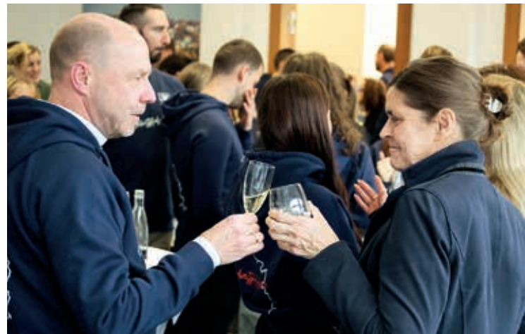
Prost! Auf ein erfolgreiches Jahr!