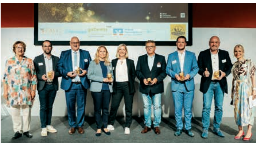
Preisverleihung „Unternehmen der Zukunft“