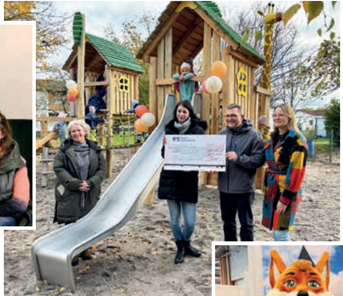
Kita Sonnenblume bei der Einweihung des neuen Kletterturms