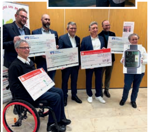
Förderverein Patientenforum Städtisches Krankenhaus Pirmasens e.V. erhält die Förderung für das Ärztestipendium