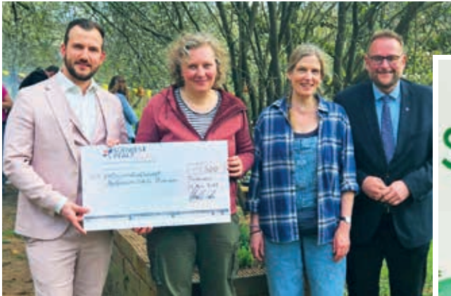
Übergabe des Grünen Klassenzimmers an die Montessori-Schule durch die Stiftung