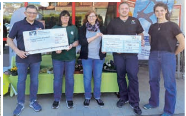
Spendenübergabe an den Förderverein Thalfröschlein e.V.