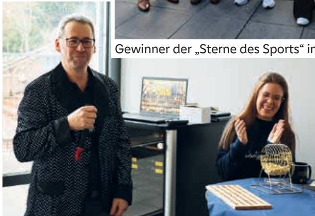
Bingo-Zeit beim Neujahrsempfang