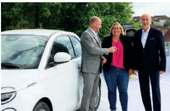
Glückliche Autogewinnerin beim Gewinnsparen 2025