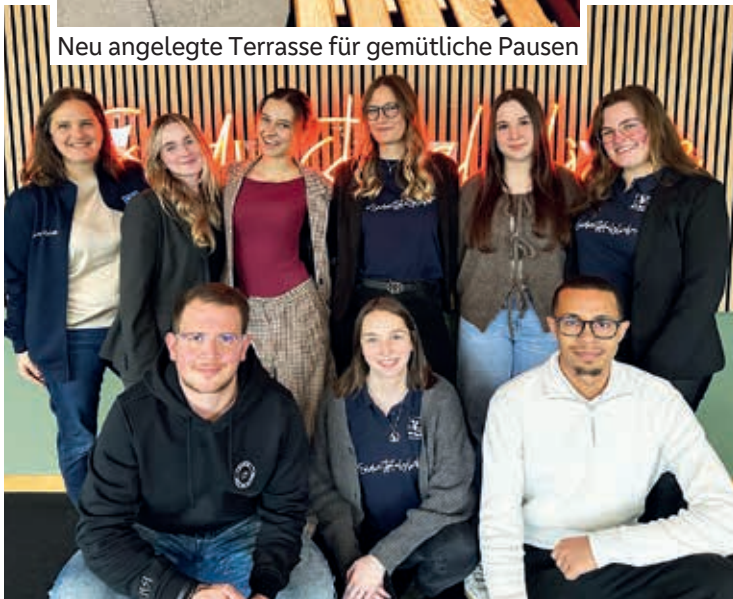
Unser neues Social Media Team