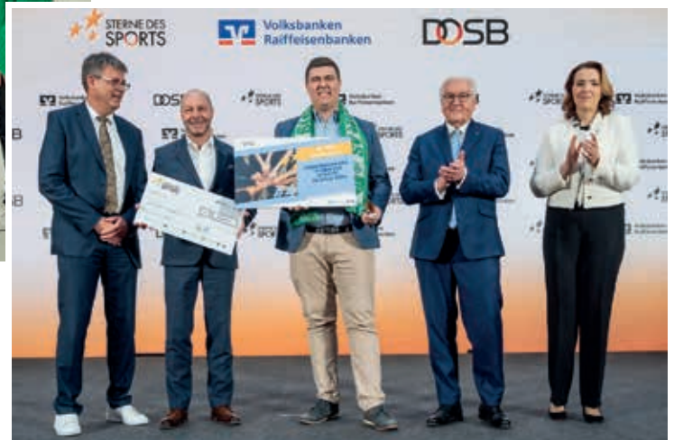
Der SV Lemberg erreicht den vierten Platz bei den „Sterne des Sports“ 2024 im Januar 2025 in Berlin