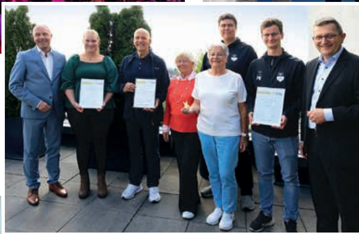
Gewinner der „Sterne des Sports“ in Bronze 2025