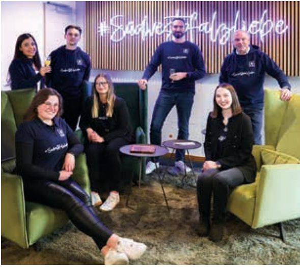
Die Ausgelernten sind bereit