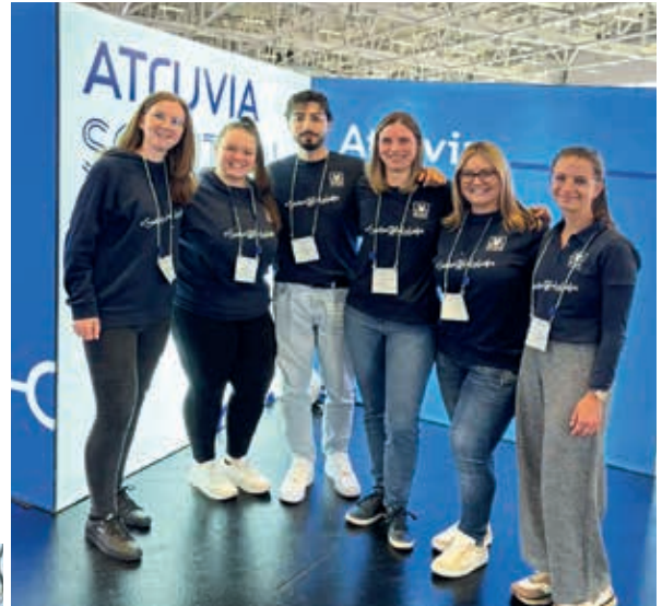
Kollegen bei den Atruvia Solution Days