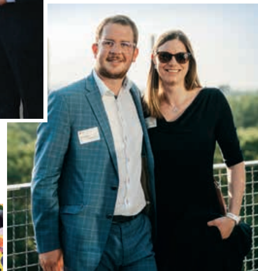
Preisverleihung „Unternehmen der Zukunft“