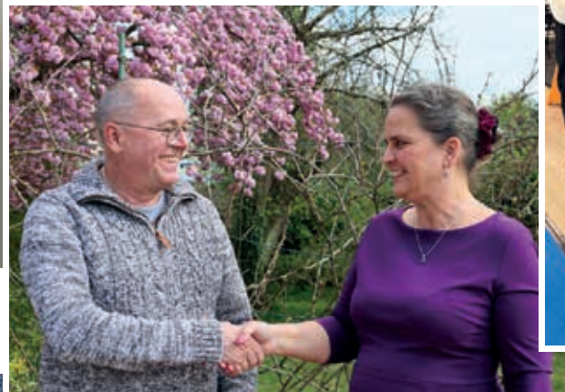
Glücklicher Gewinner beim Gewinnsparen