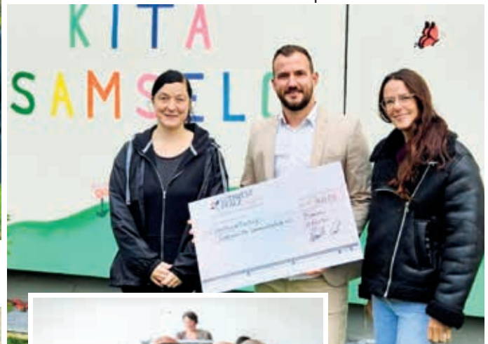
Die Kita Sommerwald schult die Vorschulkinder im Thema Brandschutz und wird von der Stiftung Südwestpfalzliebe unterstützt