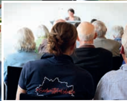
Volles Haus bei Literatur im Gespräch