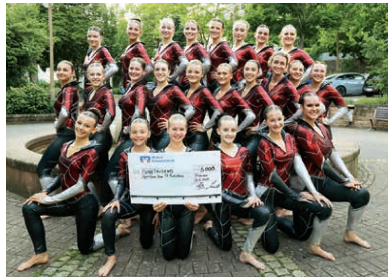
Gym & Dance des TVR bei der Vertreterversammlung 2025