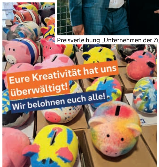
Gewinnspiel für bemalte Sparschweine zum Weltpartag