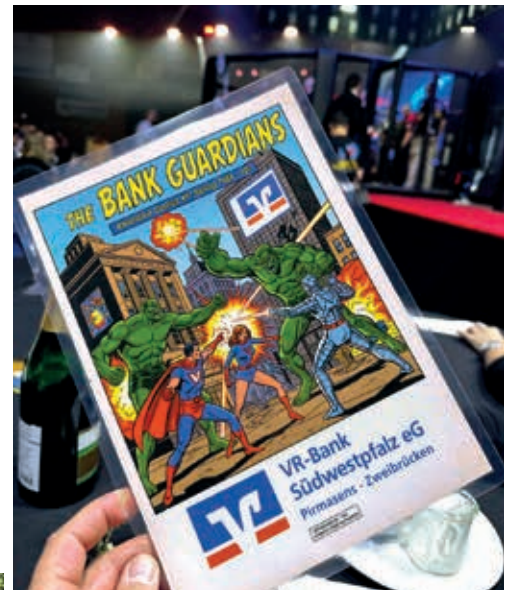
Guardians-Werbung bei der Knockout Charity Fightnight