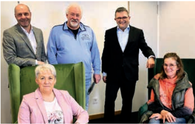
Gewinnübergabe zum Registrierungsgewinnspiel von MeinPlus