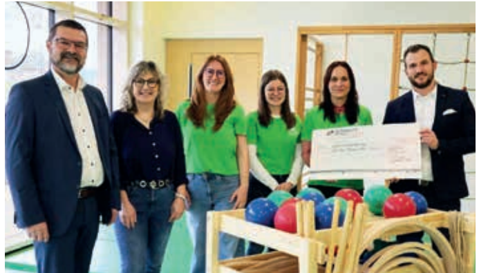
Erste Spendenübergabe der Stiftung Südwestpfalzliebe ging an die Kita Maria-Theresien-Straße