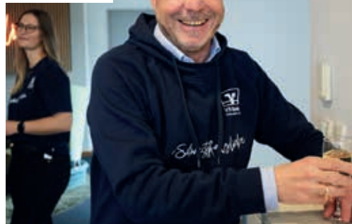
Freude über die Fachkräfte der Zukunft