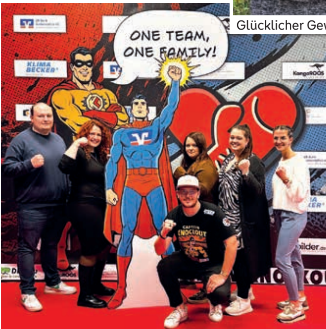
Team der VR-Bank bei der Knockout Charity Fightnight