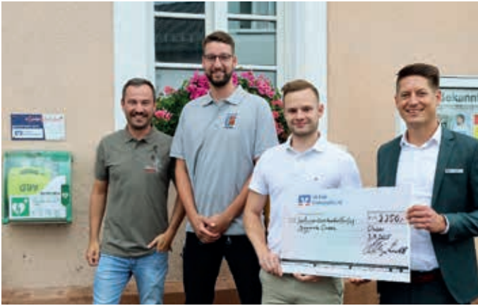
Spende für einen Defibrillator in Clausen