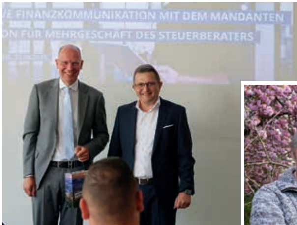
Steuerberaterfrühstück bei uns in der VR-Bank Südwestpfalz eG