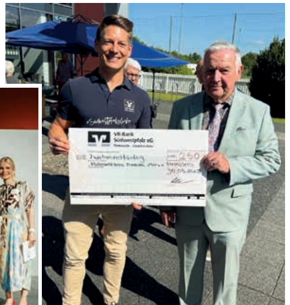
Spende an die Pfälzer Waldhütte „Drei Buchen“ zum Jubiläum