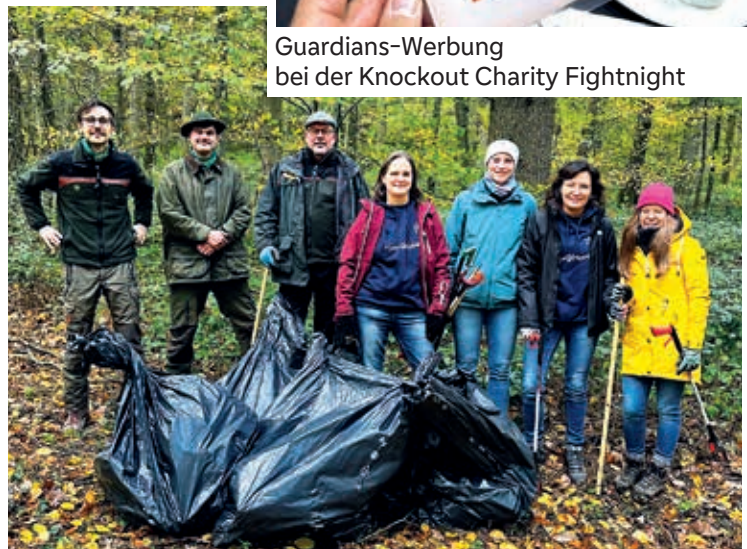
Müllsammelaktion im Pirmasenser Wald