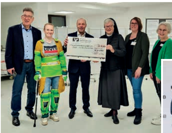
Spendenübergabe an das Nardini-Klinikum Zweibrücken für ein Ausbildungsmodul zur Simulation des höheren Alters