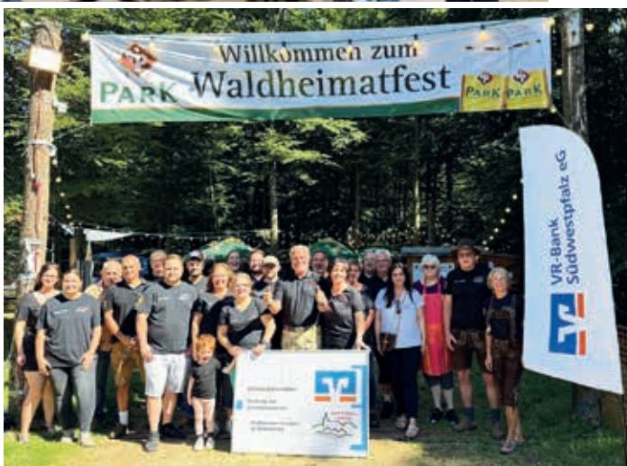
Erfreute Gesichter beim Waldheimatfest