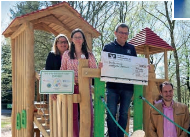
Neuer Kletterturm für die Kita Gersbach