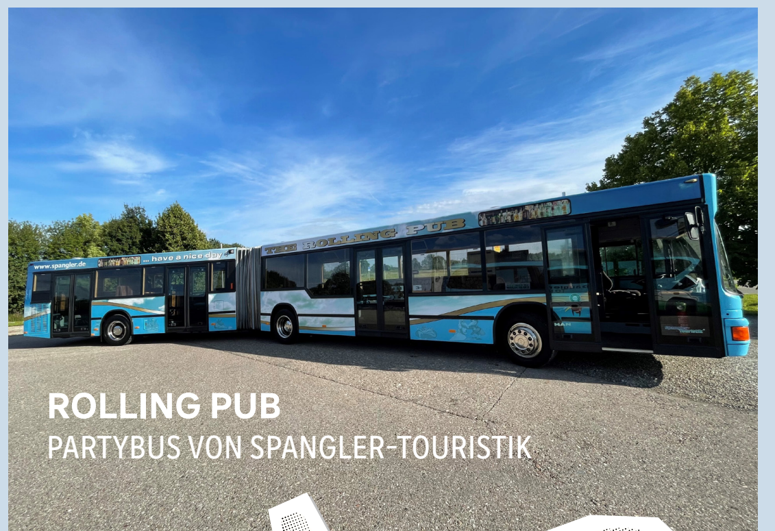
ROLLING PUB PARTYBUS VON SPANGLER-TOURISTIK