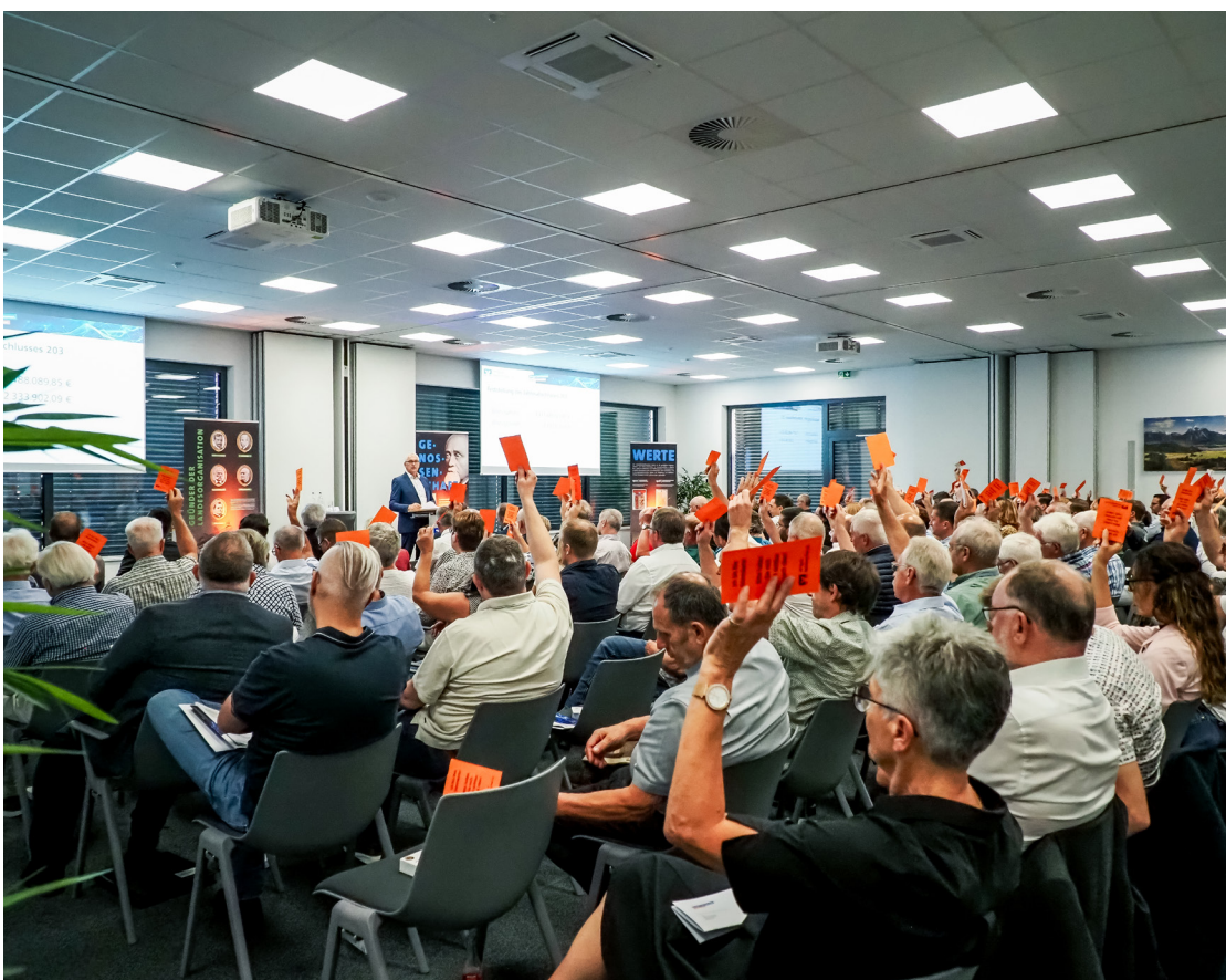
Abstimmverfahren bei der Vertreterversammlung in Kreut

behaupten kann. Die anwesenden Vertreter würdigten diese herausragende Leistung und es wurde betont, wie wichtig eine solide finanzielle Basis für die vielversprechende zukünftige Entwicklung der Bank ist.