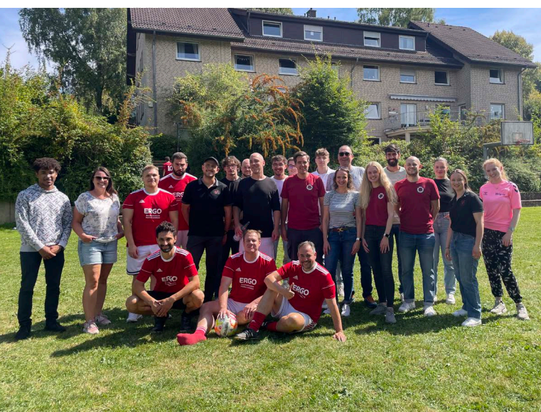
Mitarbeitende der Bank engagierten sich gemeinsam für die Kinder- und Jugendhilfe Maria Schutz.