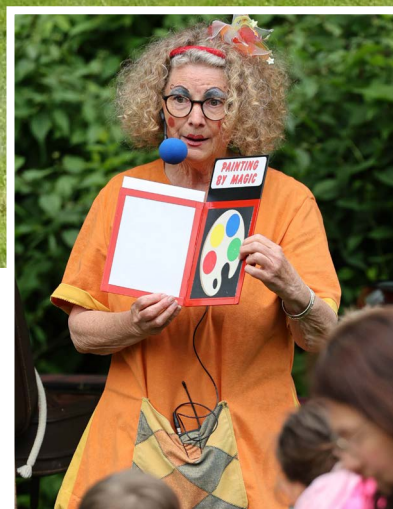
Der Benefiz-Renntag bot bunte Unterhaltung für Groß und Klein.