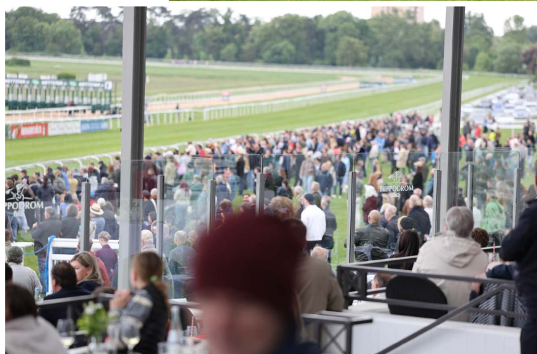
Zahlreiche Besucherinnen und Besucher verfolgten das mitreißende Rennengeschehen direkt an der Ziellinie.

Im Zentrum stand jedoch der gute Zweck. Speziell für den Renntag initiierte die Stiftung eine Spendenaktion zugunsten des „Haus Rosalie Rendu“, einem Wohnprojekt für Frauen in Not- und Krisensituationen. Gewinne aus Pferdewetten konnten freiwillig gespendet werden, die Stiftung verdoppelte die Summe. So kamen gemeinsam mit den Besuchern, dem Kölner Renn-Verein und Partnern stolze 15.000 Euro zusammen.