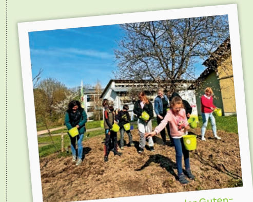
Die Kinder der Bienen-AG an der Gutenbergschule Lahr haben im März gemeinsam mit dem Naturpark Schwarzwald Mitte/Nord und der Volksbank Lahr eine neue Wildblumenwiese angelegt.

hört man es schon bald an der Gutenbergschule Lahr. Schülerinnen und Schüler der Bienen-AG haben zum Frühlingsbeginn eine neue 45 m 2 große Wildblumenwiese angelegt. Schon bald sollen dort heimische Insekten und Wildbienen Futter finden. Die Aktion ist Teil des Projekts „Unsere Region blüht und summt“, das die Volksbank Lahr seit 2019 gemeinsam mit dem Naturpark Schwarzwald Mitte/Nord betreibt. Insgesamt wurden bereits 110 Flächen auf über 54.100 m 2 angelegt.