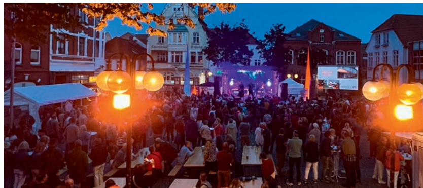
Feierlaune bis in die Nacht