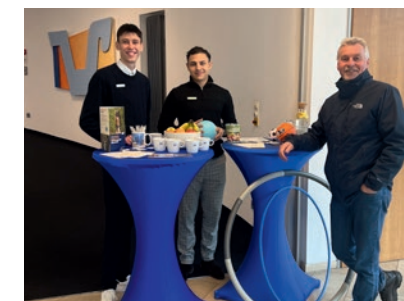
Gesundheitstag mit der R+V