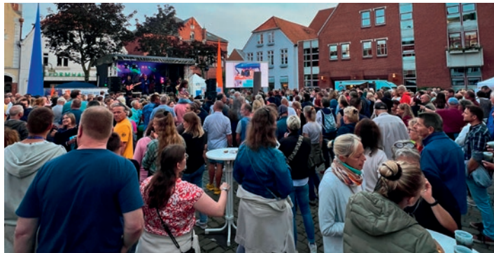
Zahlreiche Besucher in bester Stimmung