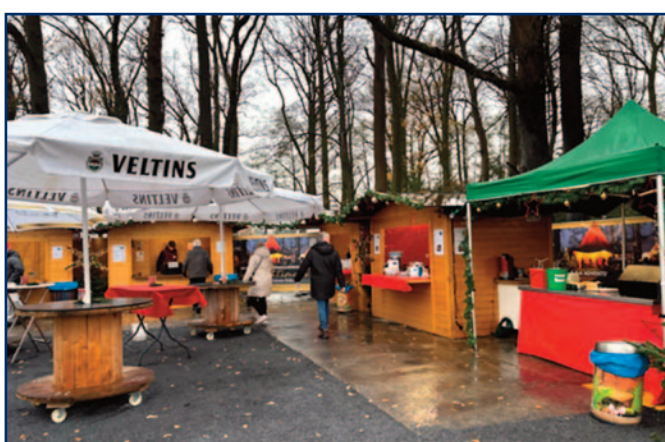
Nach einem Brand zu Beginn des traditionellen Weihnachtsmarktes auf dem Waldhof Schulze-Beikel unterstützte die Volksbank Heiden den Heimatverein Marbeck mit einer Sofortspende von 1.000 Euro. Damit konnten das vernichtete Inventar kurzfristig ersetzt werden, sodass der Weihnachtsmarkt wie geplant weiter stattfinden konnte. Jährlich kommen Tausende von Besuchern zu dem Markt nach Marbeck.