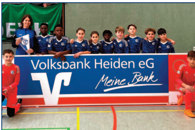
Im zweiten Jahr ist die Volksbank Heiden Teamsponsor beim EURO CUP, einem traditionellen Jugendfußballturnier des FC Viktoria Heiden 1921 e.V. mit internationaler Besetzung. Die Volksbank Heiden ist langjähriger Partner des FC Schalke 04 und freut sich besonders, das Jugendteam zu sponsorn.

Mit diesen Maßnahmen und der gezielten Förderung des Ehrenamts beweist die Volksbank Heiden, wie sehr ihr die Unterstützung des gesellschaftlichen Lebens sowie das Engagement der vielen ehrenamtlich Tätigen in Marbeck, Heiden und Umgebung am Herzen liegen.