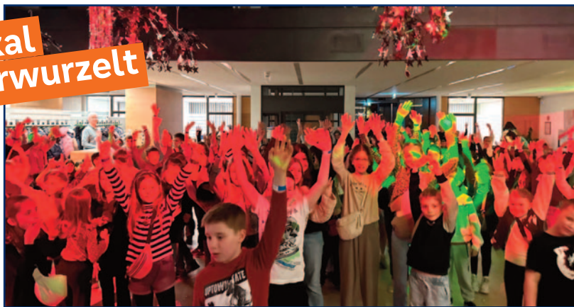
Super Stimmung bei der achten Zeugnisparty in der Volksbank Heiden.

Heiden an der Bar. Hier konnten sich die Kinder mit einer großen Auswahl an alkoholfreien Getränken und zahlreichen Süßigkeiten stärken. Damit die kleinen Gäste unbeschwert feiern konnten, unterstützte das Deutsche Rote Kreuz aus Heiden die Veranstal-