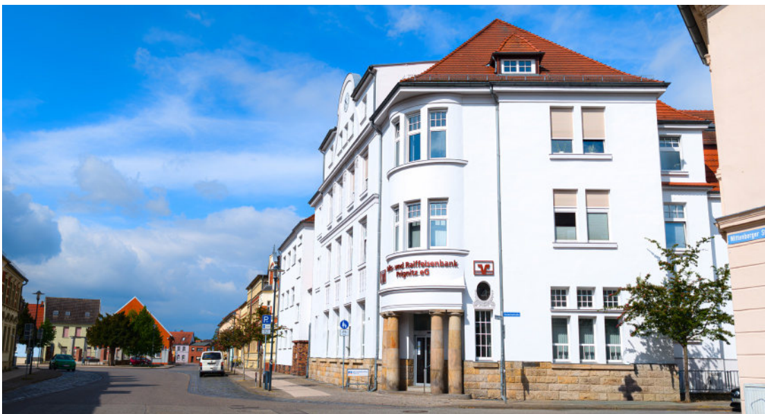
Hauptgeschäftsstelle in Perleberg.

Unsere bestehenden regionalen Bankstrukturen möchten wir auch im Jahr 2026 fortführen. Filienschließungen sind nicht vorgesehen. Damit sind wir weiterhin für unsere Mitglieder und Kunden vor Ort in den Regionen vertreten. In unserem Geschäftsbericht finden Sie auch eine Seite mit der Wahrnehmung unserer regionalen Verantwortung. Dies drückt sich u.a. aus durch unsere Spenden zur Förderung und Unterstützung von sozialen Projekten in der Region. Hier spendete unsere Genossenschaft allein im Jahr 2025 einen Betrag von 180.212,95 Euro.