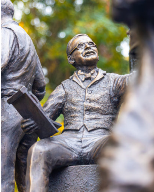
Friedrich Wilhelm Raiffeisen

Auf dem Würfel thront Friedrich Wilhelm Raiffeisen. Mit wachem Blick führt er akribisch seine Listen, gibt Geld aus und nimmt es entgegen. Als Gründer und Vordenker des Genossenschaftswesens nimmt er eine zentrale Rolle im Talerreigen ein. Um ihn herum entfaltet sich ein lebendiges Bild menschlicher Lebensrealitäten: der Geizhals mit seiner prall gefüllten Geldtruhe, der falsche Habenichts, der seine Taschen nach außen kehrt, und eine Dame, die das Glück hat, einen Taler am Wegesrand zu finden.