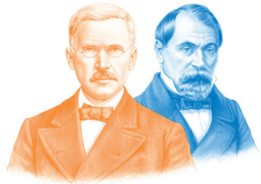
Die Gründer Friedrich Wilhelm Raiffeisen und Herrmann Schulze-Delitzsch.

Im Berichtsjahr 2025 fielen Sondererträge durch eine erhöhte Ausschüttung aus unserem bankeigenen Wertpapierfonds an, da dieser aufgrund des aktuellen Zinsniveaus erhöhte Ausschüttungen vornehmen konnte. Für 2026 rechnen wir aufgrund der fehlenden Sondererträge aus Wertpapieren mit einem leicht schwächeren Betriebsergebnis. Dieses dürfte jedoch weiterhin über dem Verbandsdurchschnitt des Genossenschaftsverbandes liegen.