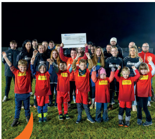
Gewinner des 6. Adventskalendertürchens: Pankower Sportverein Rot-Weiß 21.eV

Folgen Sie uns gerne auf Facebook & Instagram!