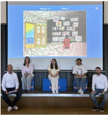
Jugend creativ Siegerehrung