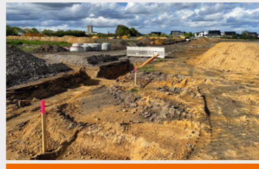
IM NEUBAUGEBIET »WOHNEN AM FREER BRUCH« FINDEN DIE ERSTEN BAUARBEITEN STATT.