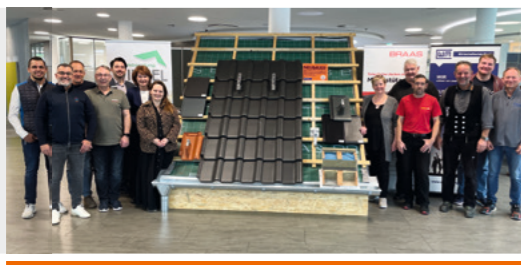
04.11. BLICKEN AUF EINE SEHR ERFOLGREICHE ERSTE VERANSTALTUNG ZURÜCK: DIE INITIATOREN, HANDWERKER UND AUSSTELLER DES 1. MARLER TAG DER ENERGIEEFFIZIENZ