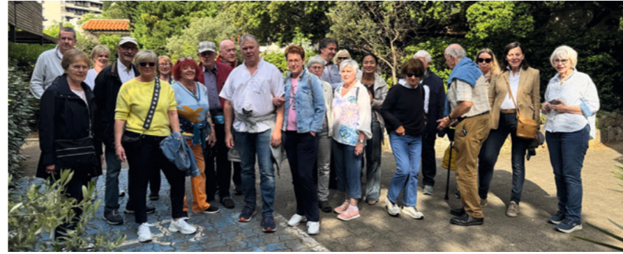
09.05. IN DIESEM JAHR FÜHRTE DIE VORSTANDSREISE IN DIE PROVENCE UND AN DIE CÔTE D'AZUR.