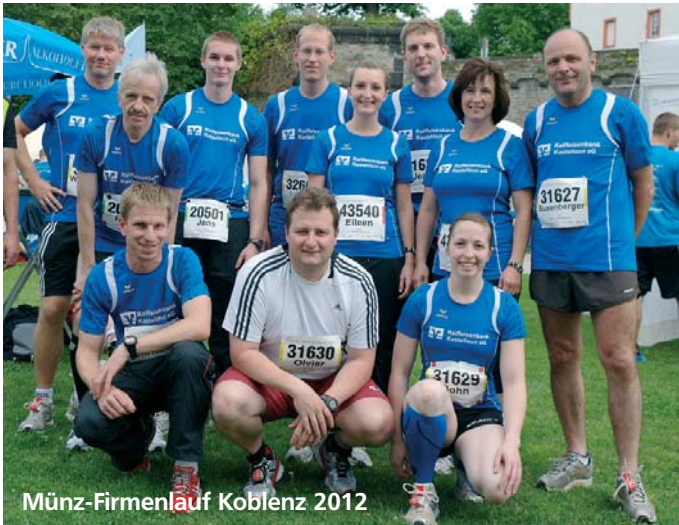
Münz-Firmenlauf Koblenz 2012