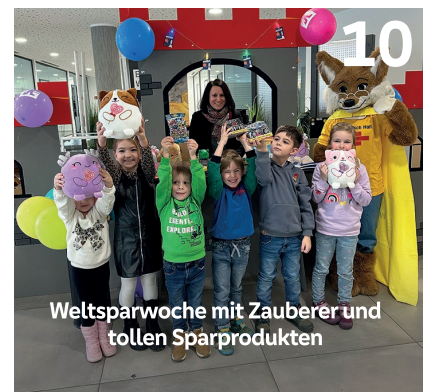
Weltsparwoche mit Zauberer und tollen Sparprodukten