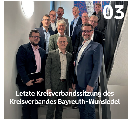
Letzte Kreisverbandssitzung des Kreisverbandes Bayreuth-Wunsiedel