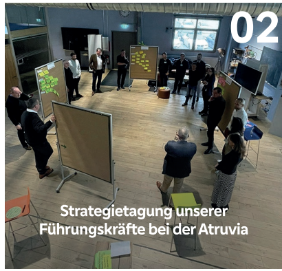
Strategietagung unserer Führungskräfte bei der Atruvia