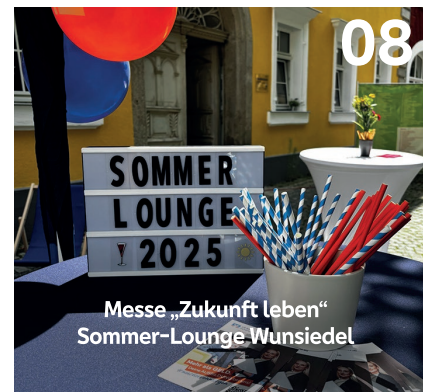
Messe „Zukunft Leben“ Sommer-Lounge Wunsiedel