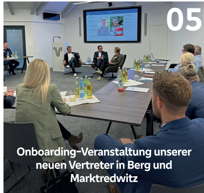
Onboarding-Veranstaltung unserer neuen Vertreter in Berg und Marktredwitz