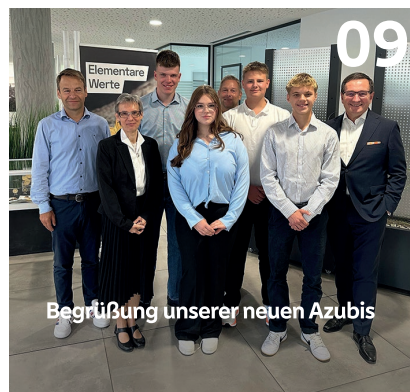
Begrüßung unserer neuen Azubis