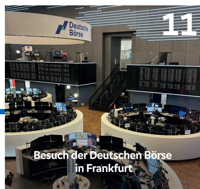
Besuch der Deutschen Börse in Frankfurt