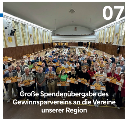
Große Spendenübergabe des Gewinnsparevereins an die Vereine unserer Region

Die Strategietagung unserer Führungskräfte stärkte den Austausch und die Weiterentwicklung unseres Hauses. Ein weiteres Highlight war die Onboarding-Veranstaltung unserer neuen Vertreter in Berg und Marktredwitz. Auch künftig möchten wir den Austausch fördern, unsere Region stärken und besondere Momente für unsere Mitglieder und Kundinnen und Kunden schaffen.