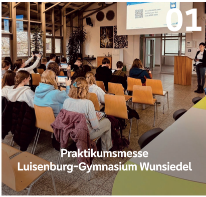
Praktikumsmesse Luisenbourg-Gymnasium Wunsiedel