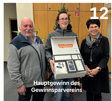
Hauptgewinn des Gewinnsparevereins