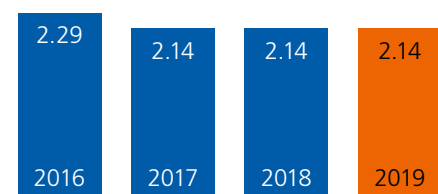
Bilanzgewinn in Mio. Euro