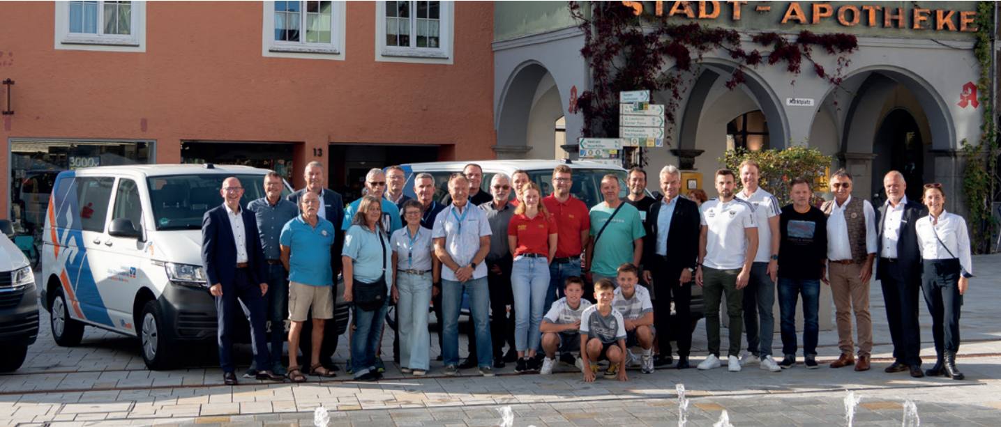
Übergabe der VRmobile 2024