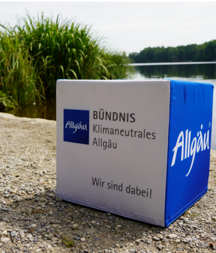
Wir sind Teil des Bündnisses Klimaneutrales Allgäu.

Bündnis Klimaneutrales Allgäu Mit unserem Beitritt zum Bündnis Klimaneutrales Allgäu in 2024 setzen wir ein klares Zeichen: Wir treiben Klimaschutz voran. Wir erstellen jährlich eine Treibhausgas-Bilanz und entwickeln gemeinsam mit dem Bündnis einen Absenkpfad, um diese Emissionen kontinuierlich zu senken. Unvermeidbare Restemissionen werden durch die Förderung hochwertiger Projekte zur CO 2 -Einsparung in der Region kompensiert.