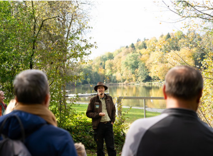
Naturführung für die Mitarbeitenden der VBAO mit dem Adelegg-Ranger.