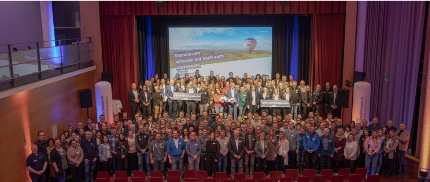
Beim VBAO-EhrenamtsAbend freuten sich 150 Vereine über 150.000,00 Euro aus dem VBAO-Adventskalender.