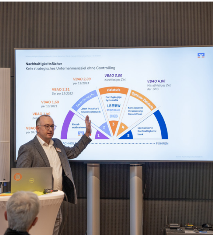
Im September 2024 haben wir unsere Firmenkunden zu einer Dialogveranstaltung zum Thema Nachhaltigkeit eingeladen.

Füreinander – miteinander. Das Thema Kommunikation, Austausch und Mitsprache ist der Dreh- und Angelpunkt der VBAO. Als Bank, die von ihren Mitgliedern getragen wird, hören wir genau hin und richten unser Handeln nach den Interessen, Erwartungen und Erfahrungen unserer Mitglieder, Kundinnen und Kunden aus. Dabei legen wir großen Wert auf einen transparenten und offenen Austausch auf Augenhöhe. Auf diese Weise fördern wir die Kundenzufriedenheit und festigen das Vertrauen in unsere Bank sowie die Qualität unserer Dienstleistungen.