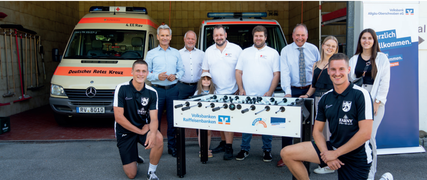
Im Rahmen der Aktion „VR-Tischkicker“ wurden vier Tischkicker, finanziert aus dem VR-GewinnSparen, an Vereine in der Region vergeben.