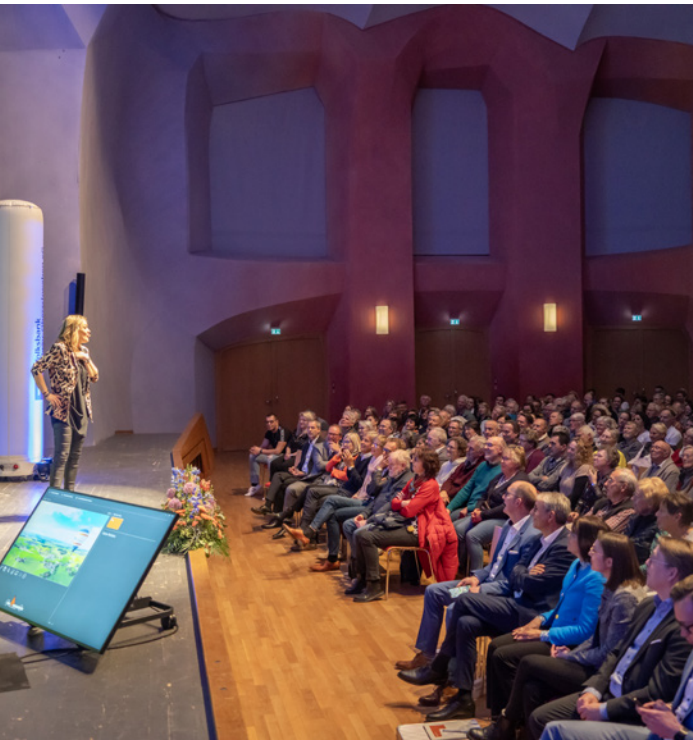
Mitgliederforum 2024 in Wangen im Allgäu

Bei unserer jährlichen Veranstaltungsreihe präsentieren wir unseren Mitgliedern die Zahlen des vergangenen Geschäftsjahres, um sicherzustellen, dass sie stets über unsere aktuelle Situation informiert sind. Im Anschluss an die Veranstaltung suchen wir bei einem Erfrischungsgetränk gerne das persönliche Gespräch mit unseren Mitgliedern, um uns über aktuelle Themen auszutauschen, die sie und uns bewegen. Zukünftig möchten wir diese Dialogformate verstärkt nutzen, um nachhaltige Inhalte einzubringen – etwa durch Gastbeiträge von Fachleuten aus dem Nachhaltigkeitsbereich. So nehmen wir unsere Mitglieder – als Miteigentümerinnen und Miteigentümer der VBAO – aktiv mit auf unserem gemeinsamen Weg in eine nachhaltige Zukunft.