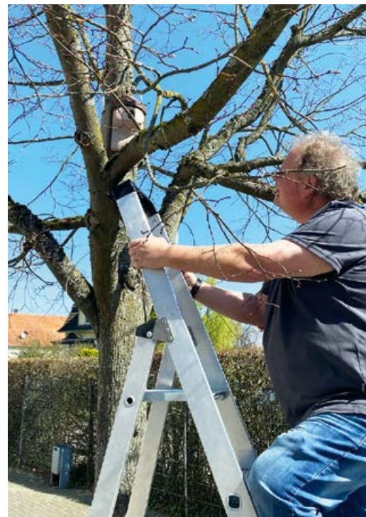
Hausmeister der Lindenschule Neuenstadt beim Aufhängen des Nistkastens.

Mit dieser Spende danken wir allen schulischen Einrichtungen herzlich für ihr Engagement. Denn sie leisten einen wichtigen Beitrag für die soziale Entwicklung der Kinder und somit für die gesamte Gesellschaft.